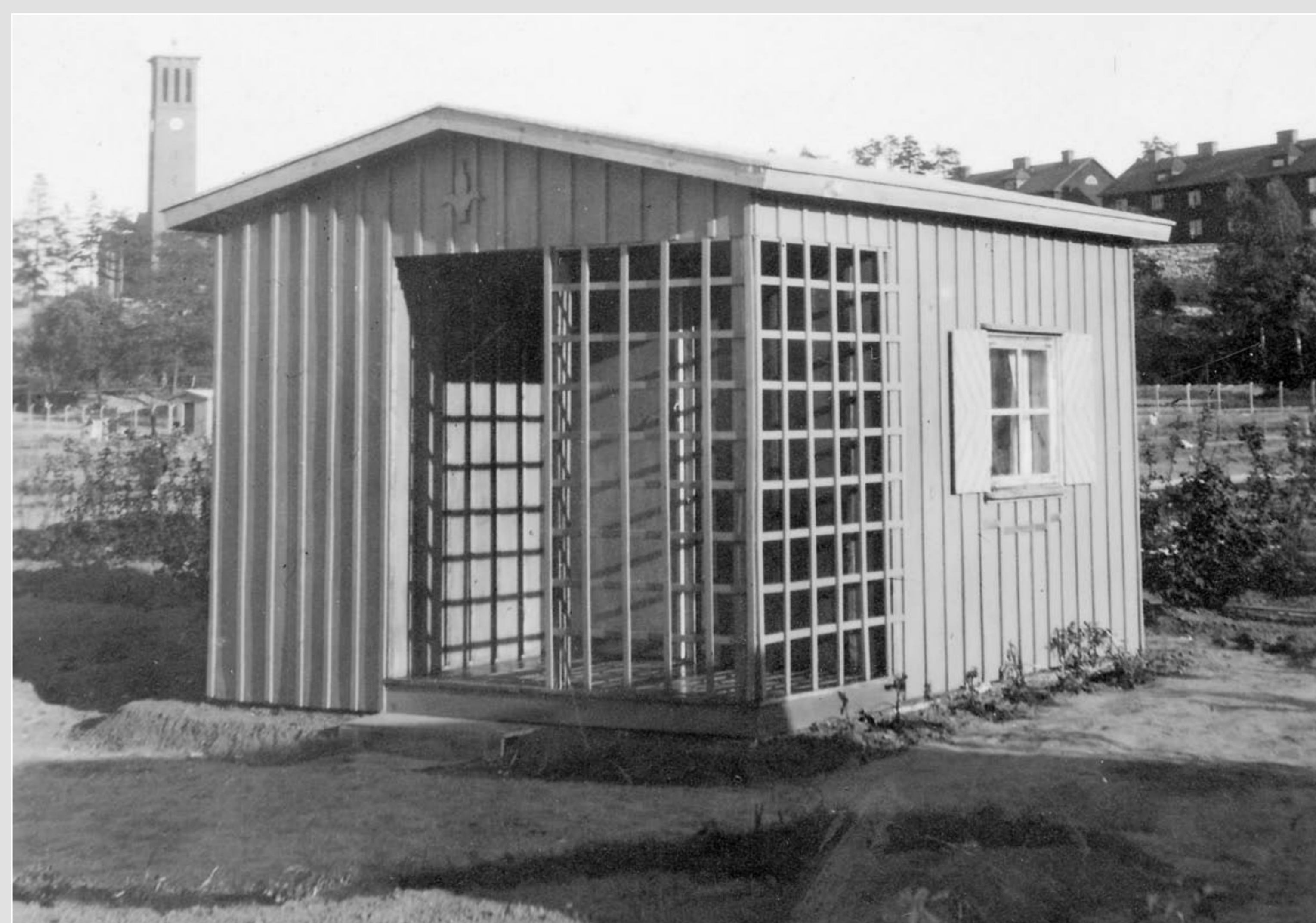
Uuden mökin ympärillä on aloitettu puutarhatyöt. Kuvausaika 1932 - 1933.

Asemapiirustus määritteli majan ja käytävän sijainnin palstalla. Suorat linjat ja suunnitelmallisuus olivat lähtökohta kun palstaa alettiin muokata. Kiinteistövirastolta sai lunastaa palstalle istutussuunnitelman ja puutarhakonsultti kävi paikan päällä neuvomassa palstan suunnittelussa ja viljelyn periaatteista. 6