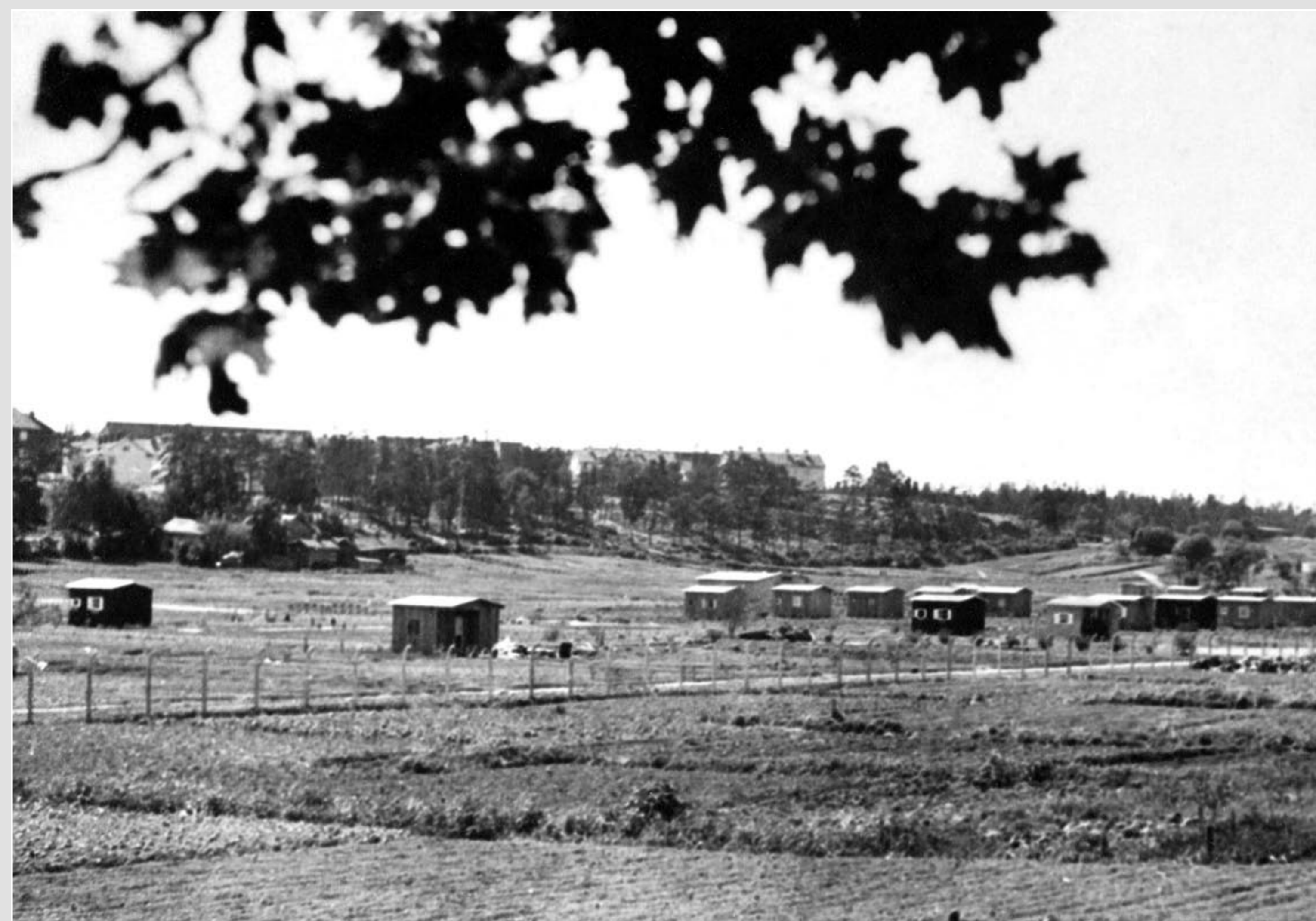
Ensimmäisiä mökkejä vuonna 1932. Etualan maa-alue oli kaupunkilaisten viljelykäytössä. Kuvassa näkyy siirtolapuutarha-alueen ympärille rakennettu aita ja sen vieressä Pihlajapolku.