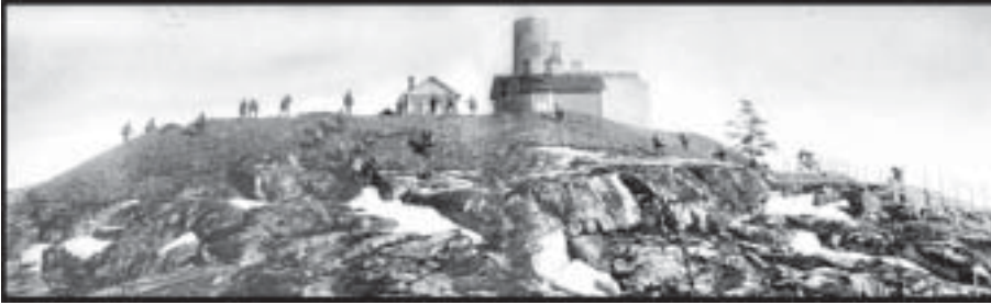
Saksalaiset Iimalan kalliolla

Läheisen Iimalan aseman ympäristössä ja nykyisen Yleisradion kalliolla käytiin keväällä 1918 raju yhteenotto Saksan armeijan ja suomalaisen punaisen joukon välillä. Taistelu Iimalan kalliosta on ainoa Helsingissä koskaan käyty maasotatoimi. Sen muisto on kuitenkin osa katoamassa olevaa paikallishistoriaa ja hävinneen työväenliikkeen historiaa.