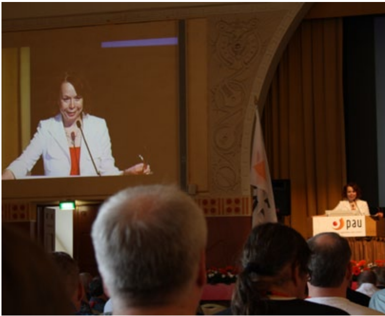
Asunto- ja viestintäministeri Pia Viitanen tuomitsi videokoodauksen siirron yhteiskuntavastuun laistamisena.