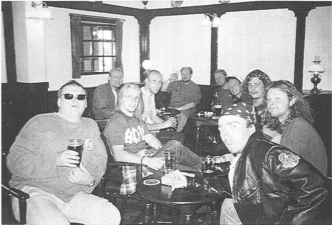
Kevyt rentoutumishetki isäntien kerhotalon pubissa. Kuva liittyy sivulla 19 olevaan juttuun "Böölen pojat Britanniaassa".