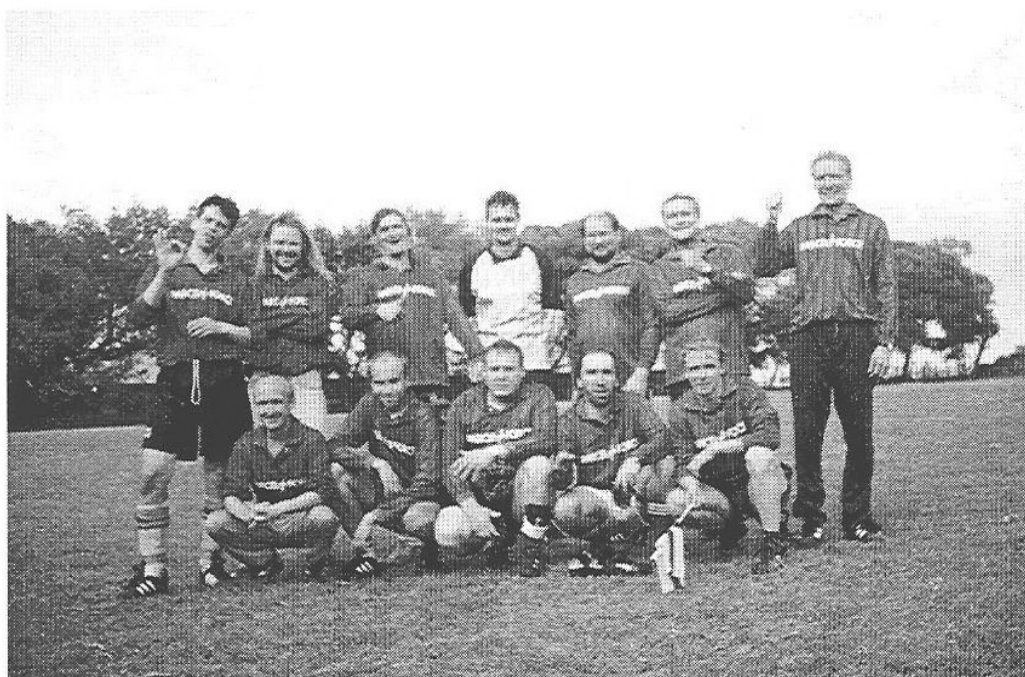
Böölen pojat potgretissa kovan mutta rankan ottelun jälkeen

Sitten pääsimme itse asiaan eli kisojen seuraamiseen. Valitettavasti se rajoittui - meistä riippumattomista syistä - pelkkään TV:n katselemiseen. Tästä saamme kiittää pääsylippujen hinnoittelua, joka oli kyllä lievästi sanottuna yliammuttua. No, se oli kuitenkin vain harmittava lievä takaisku, ei muuta. Se ei kuitenkaan meidän kisatunnelmaa latistanut. Se oli koko ajan korkealla. Ja onhan se futiksen katselu TV:stä ihan kivaa, vaikka ei tietysti pysty aitoa paikanpäällä katomista korvaamaan.