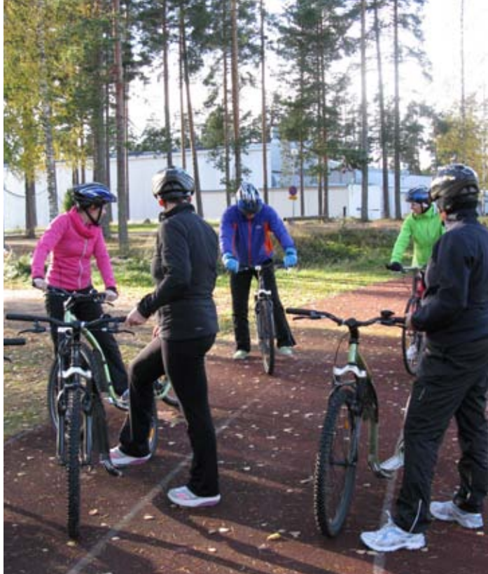
Kickbiken alkeita harjoiteltiin urheilukentällä.

Osallistuin loppusyksystä myös kahteen kuntoremonttiin. Hain niitä palkansaajajärjestöjen yhteisestä kattojärjestötä PHT ry:stä, jonka sivuilla on monia eri vaihtoehtoja. Hain remonttia myös Itellalta,