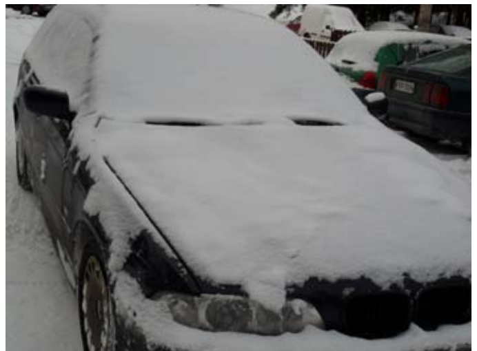
BMW odottaa parkkipaikalla kuljettajan tervehtymistä.

No, onneksi on vielä peliaikaa. Menen sitten aamulla normaalisti töihin. Ekalla tauolla kuppi kahvia ja ulos tupakille.