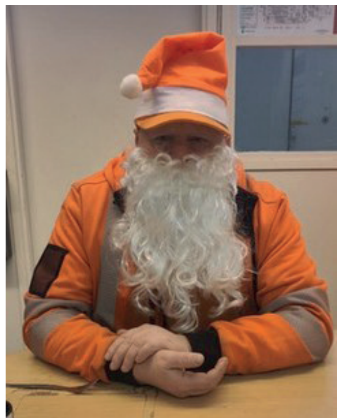
Jotkut onnistui näkemään Pokissamyös tällöisen joulujukin.