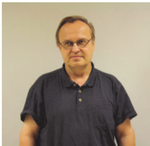
Esa Harra varapääluottamusmies Ulk