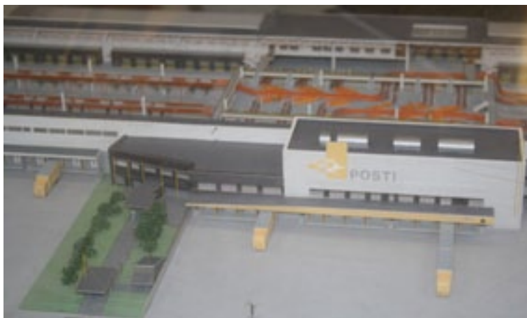
Talon pienoismalli on Logistiikkakeskuksen ala-aulassa.

Harrastukset: - kitaran ja koskettimien soitto - säveltäminen - strategiapelit, kuten shakki ja Crable - penkkiurheilu