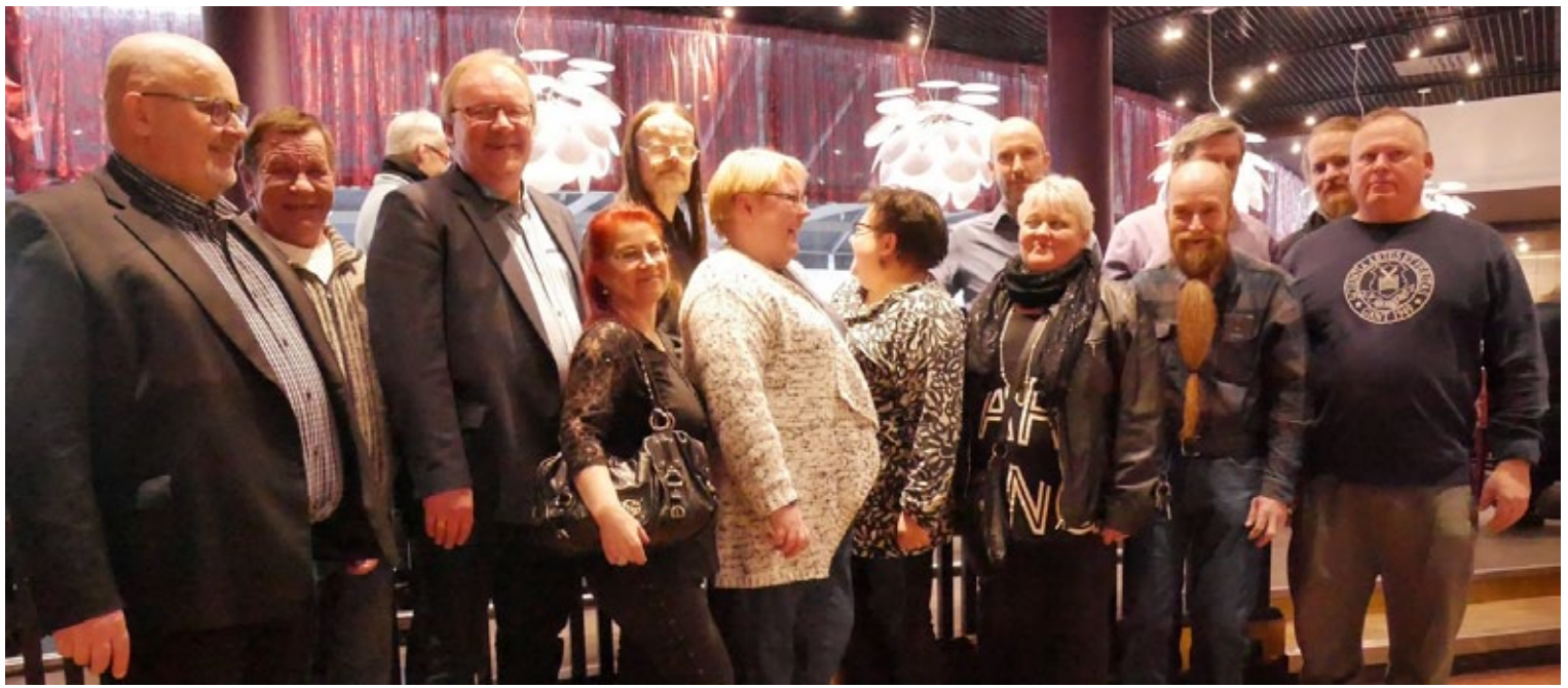
Toimikunnan jäseniä yhteispotretissa.