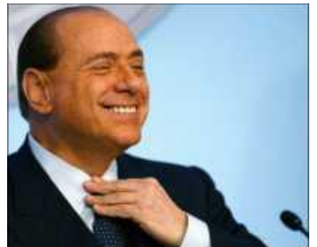
avohakkuu eli silo