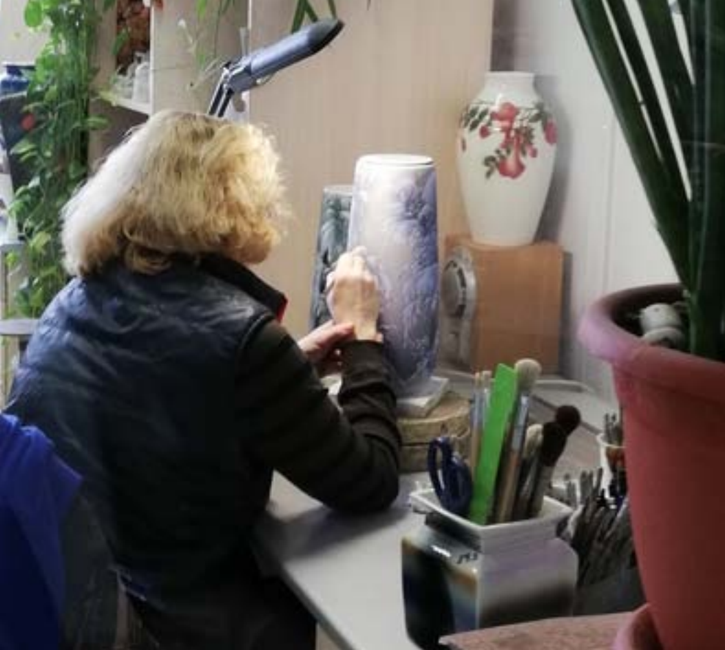
Taiteilija maalaa maljakkoa Lomonosovin posliinitehtaassa.