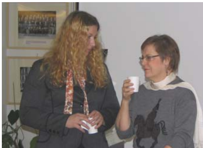
Välillä maistui kahvi...