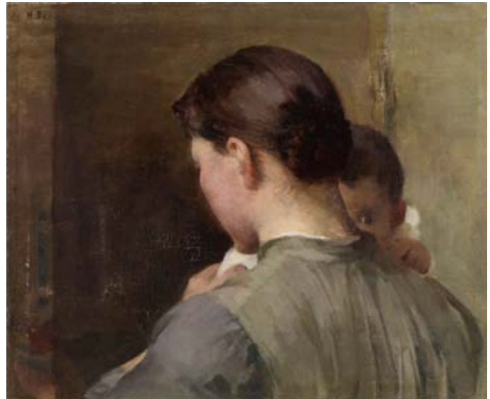
Helene Schjerfbeck: Nainen ja lapsi (n. 1887)

Ja sitten se pieni sensaatio. Meillä oli onni nähdä Schjerfbeckin ennen tuntematon maalaus, joka äskettäin mediakohun saattelemana löydettiin ja oli nyt ensimmäistä päivää esillä yleisölle. Kyseinen maalaus löytyi konservointityön aikana yksityisomistuksessa olevan maisemamaalauksen alta, minne taiteilija oli sen omin käsin ommellut. Maalaus esittää selin olevaa naista, jonka olkapään yli pieni lapsi kohdistaa katsojaan aran katseen. Mutta miksi taiteilija on halunnut kätkeä tämän maalauksen? Oppaamme esitti arvelun, että taulun teema oli taiteilijalle arka ja kipeä, sillä hänen kihlauksensa englantilaisen taiteilijan kanssa oli kariutunut ja tiedettiin, että hän suri lapsettomuuttaan. Lopullista syytä emme ehkä koskaan saa tietää, mutta kenties mysteeri, joka taulua ympäröi, vain lisää sen viehättävyyttä.