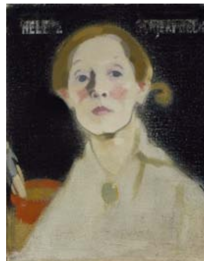
Helene Schjerfbeck: Mustataustainen omakuva (1915)

Ateneumiin on koottu laajin Schjerfbeckin tuotannosta koskaan järjestetty näyttely taiteilijan syntymän 150 -vuotispäivän kunniaksi. Se sisältää yli 300 teosta taiteilijauran kaikilta kausilta 1880-luvun historiamaalauksista myöhäiskauden pelkistettyyn modernismiin. Näyttelyssä on myös ennen näkemättömiä tai harvoin nähtyjä teoksia useista yksityiskokoelmista. Laajan näyttelyn vuoksi oppaamme oli mahdotonta esitellä meille läheskään kaikkia teoksia, mutta saimme hyvän käsityksen taiteilijan tuotannon eri kausista ja kuulumme mielenkiintoisia kertomuksia monien teosten syntyhistorioista.