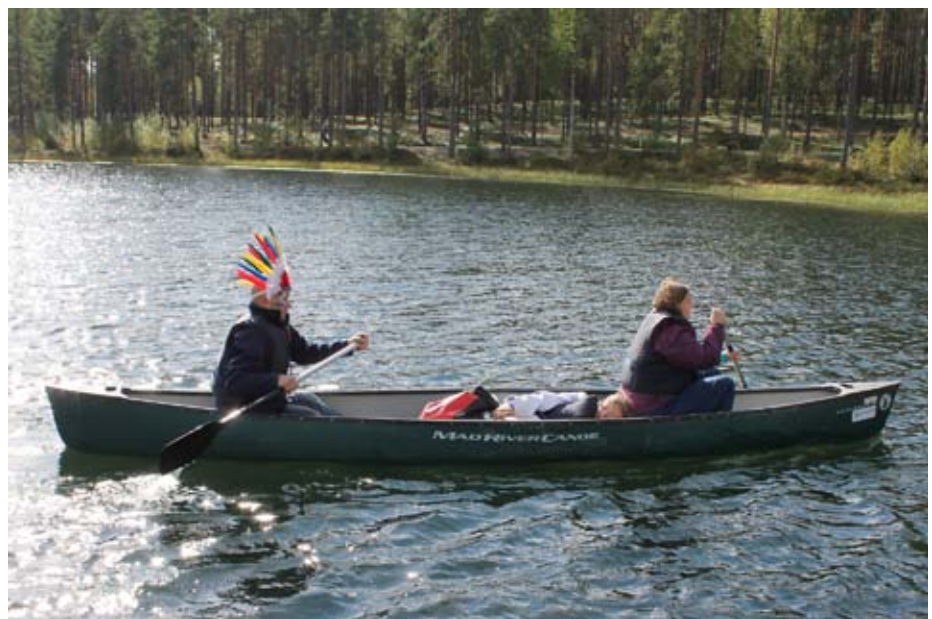
Inkkarikisan voittajajoukkue vauhdissa kanoottiosuudella.