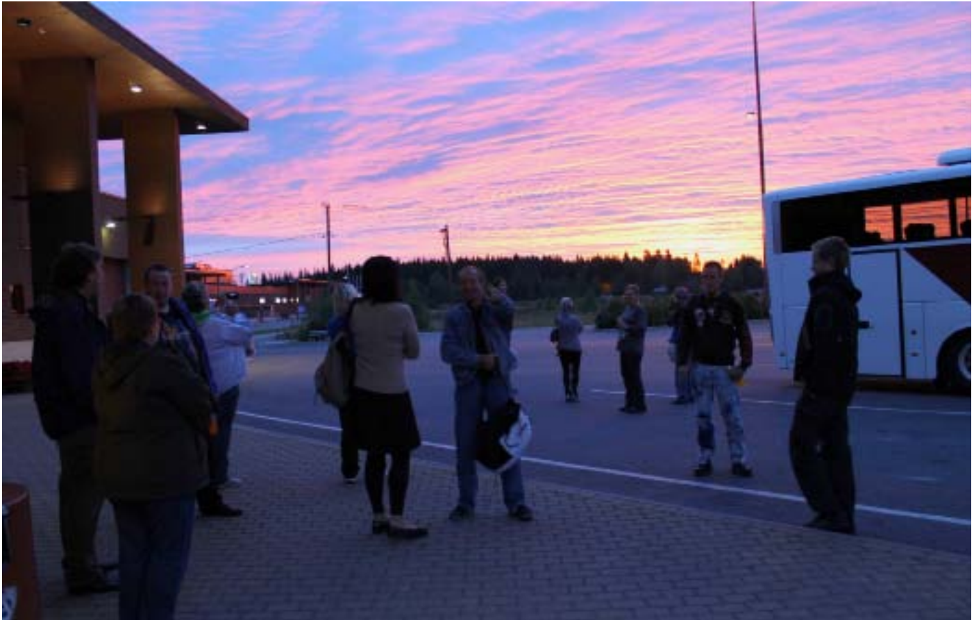
Aamuauringon sarastaessa pysähtyi Helsingin bussin porukka kuljettajan lepotautille Jyväskylän takana Hirvaskankaan ABC:llä.