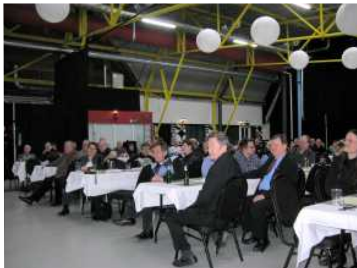
Vuosikokous houkutteli vajaa sata henkeä Koskikeskukseen.