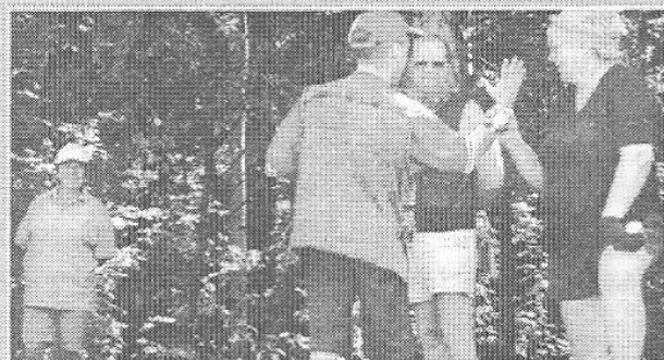
Le Coplalla onnistui kohtalaisesti.