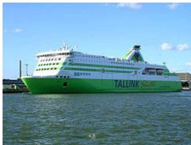
TallinkSiljan alus M/S Star.