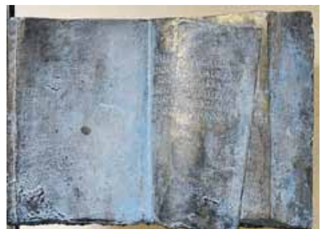
Kirjatyöntekijäin yhdistyksen perustamisen muistolaatta Forumissa. "Tällä paikalla sijainneessa Auran kirjapainossa perustettiin Turun kirjatyöntekijäin yhdistys vuonna 1890.

Lisätietoa Turun Kirjatyöntekijöiden toiminnasta ja historiasta sekä toimiston ja Rantalan käyttömahdollisuuksista: tkyturku.fi