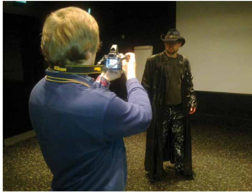
Molemmissa kuvissa tallennetaan Kalevala-videon harjoitusta Vimman studiotalassa Turussa.

Turun Elokuvaajat toivoisi jatkossa enemmän yhteistyötä myös eri puolilla Suomea toimivien yhdistysten välille.