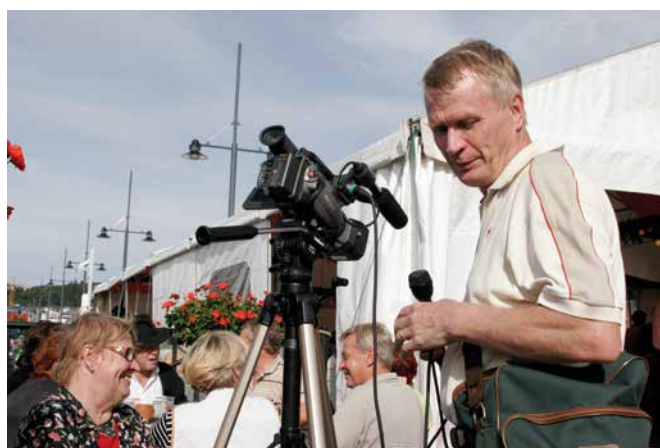
Lahden 100-vuotisjuhlassa satamassa haastattelua tekemässä

Tipalan koulun 100-vuotisjuhliin tekemäni dokumentti vuonna 2009 oli pitkän suunnittelun tulos. Seurasin koulun arkipäivää yli vuoden ajan. Dokumentin kuvausmateriaalia kertyi kaikkiaan 40 tuntia. Koulun juhlasalissa elokuvan näki 100 oppilasta ja saman verran juhluvieraita. Elokuva näytettiin kahdelta videotykiltä yhtäaikaan salin muodon takia. Dokumentti lienee vielä tänäkin päivänä ainoa lahtelaisesta koulusta tehty elokuva.