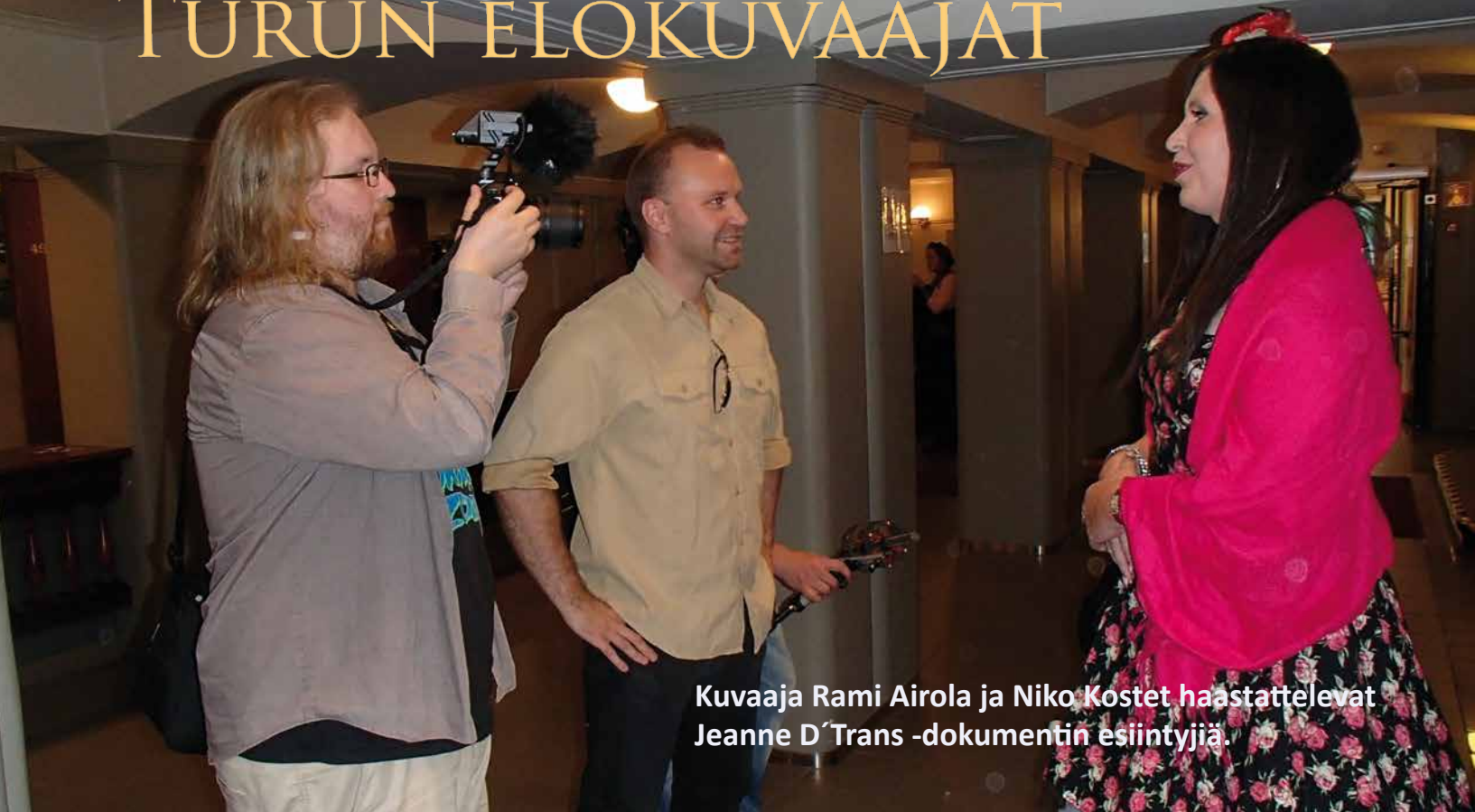
Kuvaaja Rami Airola ja Niko Kostet haastattelevat Jeanne D'Trans -dokumentin esiintyjää.