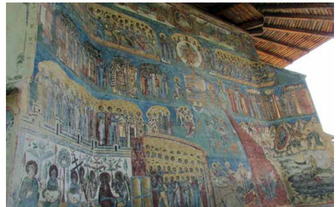
Retkipäivänä nähtiin Voronetin kuvakirkko, Unescon maailmanperintökohte