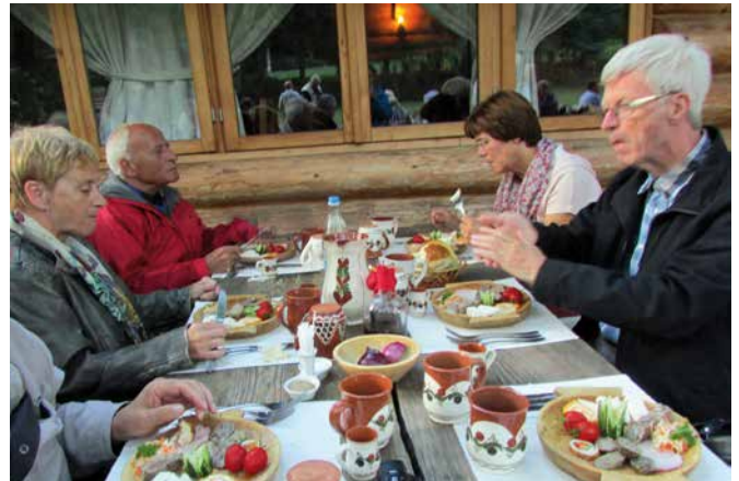
Romanialaista runsasta kulinarismia oli tarjolla myös retki-illallisella. Pöytäseurana hollantilaisia Unica-ystäviä.