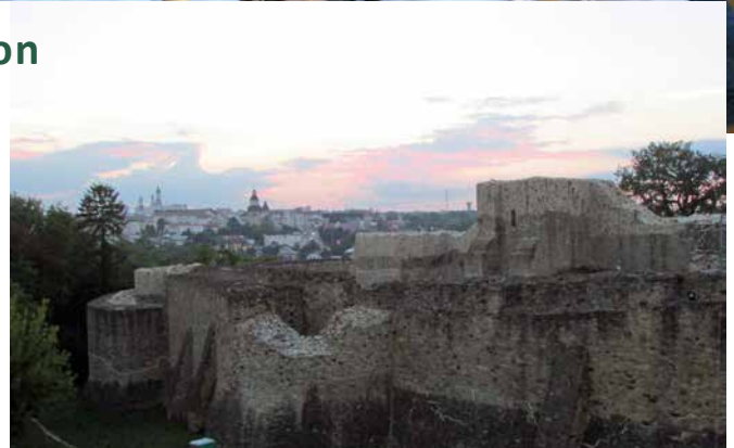
Suceava linnoitukselta) Suceavan silhuetti linnoitukselta, missä Unican avajaiset pidettiin. Linnoitus on perustettu v. 1390.

Voronetin luostarikirkon siniselle pohjatulle maalatut kuvat ovat erityisen vaikuttavia. Karpaattien vuoriston näkymät avautuivat retkibussin ikkunoista.