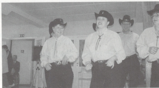
Rivitanssiryhmä Valkeakoskelta veti yleisöäkin mukaan tanssin kuvioihin.

tä kesältä, mutta jotta ensikesä tulisi on vietettävä talvi välissä.