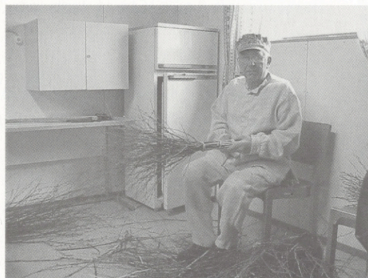
Kehräystä ja luudansiteen valmistusta esittelevät Keuruun Invalidiyhdistyksen aktiiviset jäsenet.