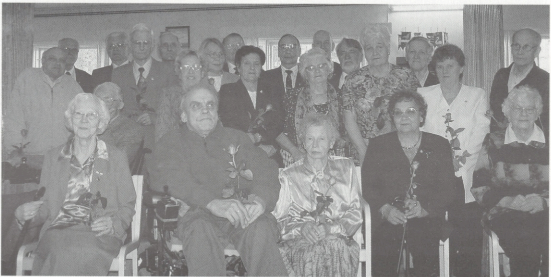
Ansiomerkin saaneet jäsenet yhteiskuvassa.