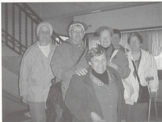
Tampereen likat kulttuuripäivillä