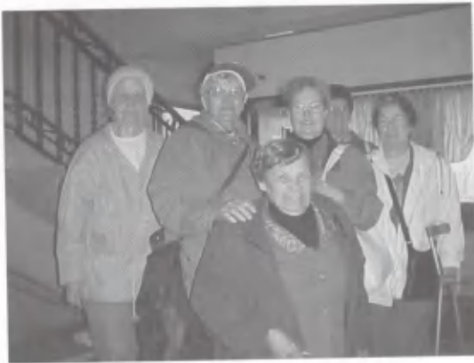
Tampereen likat kulttuuripäivillä