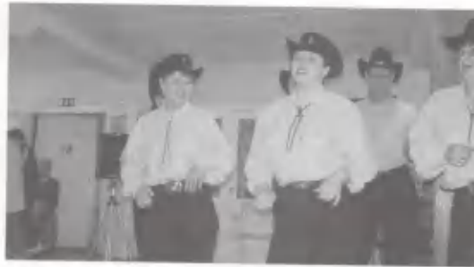
Rivitanssiryhmä Valkeakoskelta veti yleisöäkin mukaan tanssin kuvioihin.

tä kesältä, mutta jotta ensikesä tulisi on vietettävä talvi välissä.