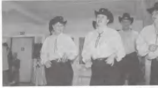
Rivitantsiryhmä Valkeakoskelta veti yleisöäkin mukaan tanssin kuvioihin.

Aitorannan päättäjäisiä vietettiin 16.08. Kauniin kesän vielä jatkuessa oli vähän haikeata päätellä kesäkodin toimintaa täl-