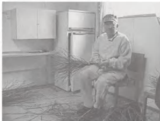
Kehräystä ja luudansiteen valmistusta esittelevät Keuruun Invalidiyhdistyksen aktiiviset jäsenet.