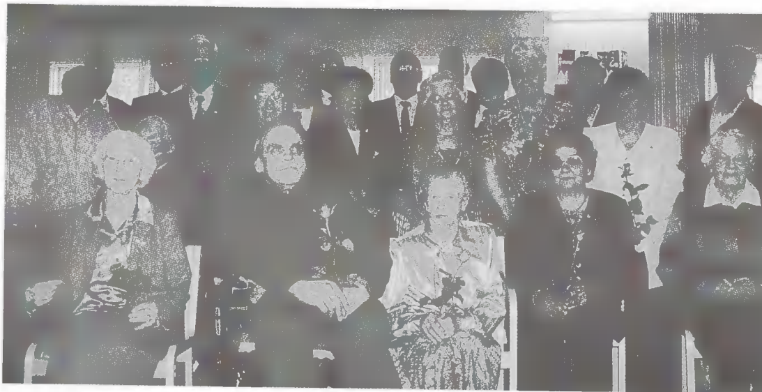
Ansiomerkin saaneet jäsenet yhteiskuvassa.