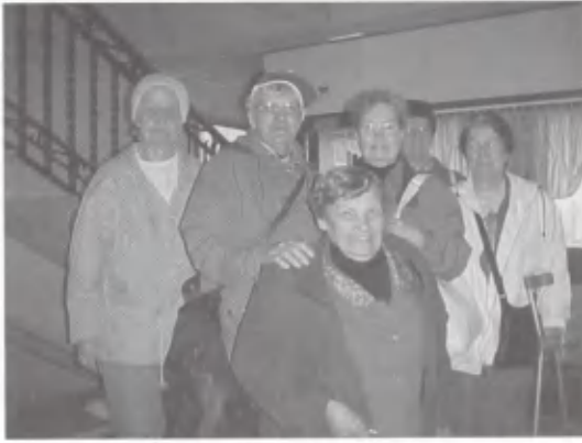
Tampereen likat kulttuuripäivillä