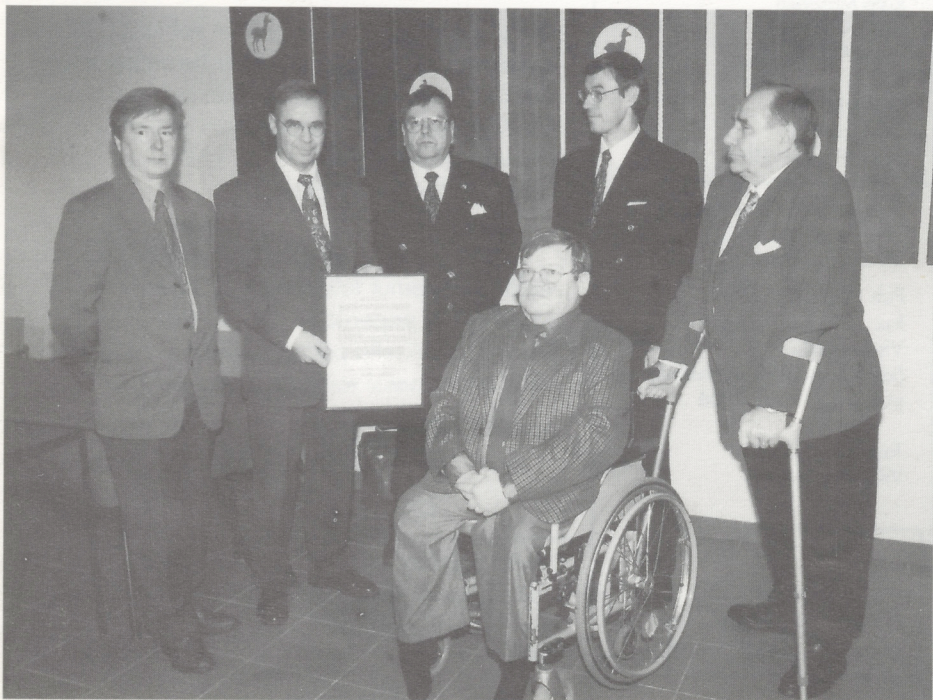
Yhdyskuntasuunnittelupalkinto Tampereelle. (katso sivu 13)

Sisältää toimintakertomuksen vuodelta 1997