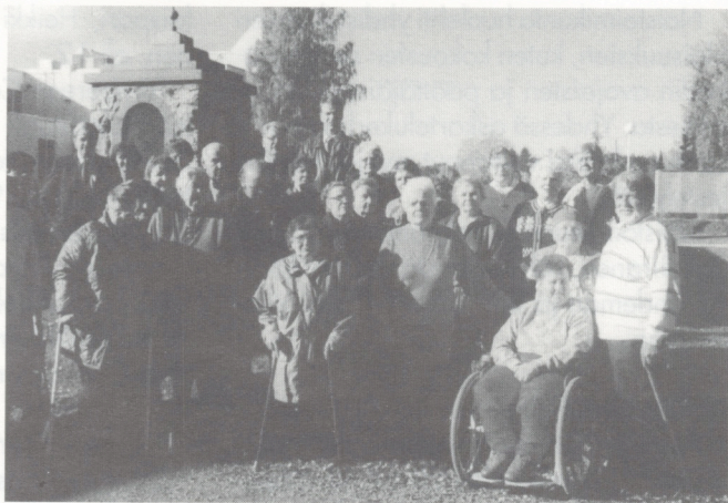
Kerholaiset retkellä Tammelan kirkon seutuvilla