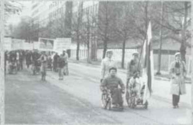
Esteet pois -kampanjan mielenosoituskulkue Tampereella.