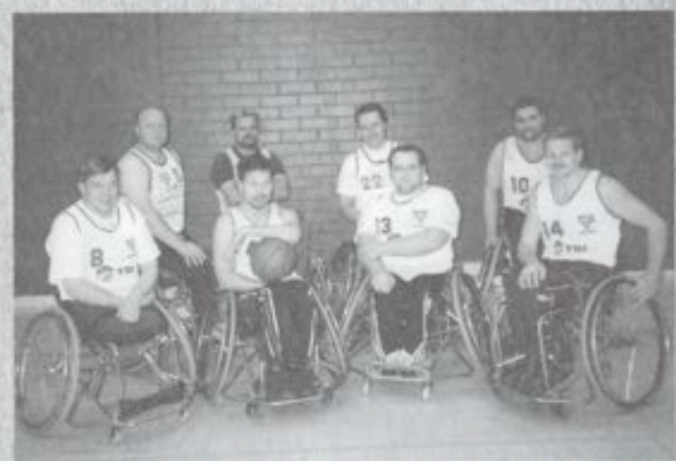
Yläkuvassa pt-koripallojoukkueemme pelaajia muutaman vuoden takaa. Alla voitokkaita boccia edustajiamme palkintoineen.