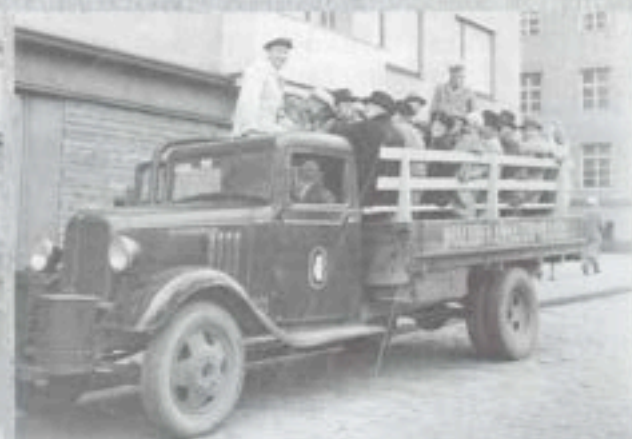
Ennen vanhaan kuljettiin näin. Väki lähdössä Kolmirantaan v.1945.