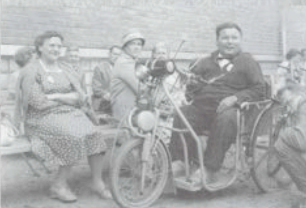
Retkeilypäivään osallistuneita 1960.