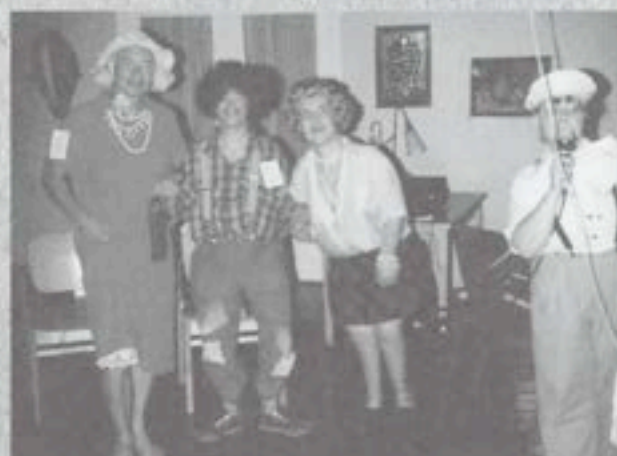
Mister Aitoranta -kilpailu, naamiaiset, näytelmät ja iltamat ovat hauskuttaneet niin jäsenistöä kuin lomanviettäjiäkin.