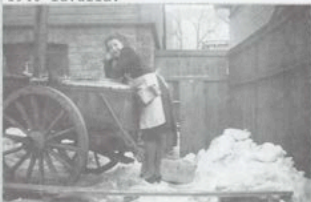
Yläkuva. Yhdistys hoiti muonituksen Invalidiliiton hiihtokilpailuissa Tampereella. Alakuva. Makkaran myyjät Näsinkalliolla TT/ajoissa.