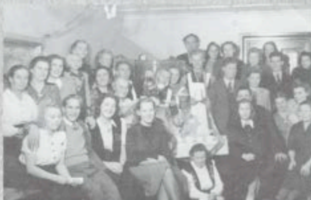
Illanvietto kerhohuoneella 1940-luvulla.