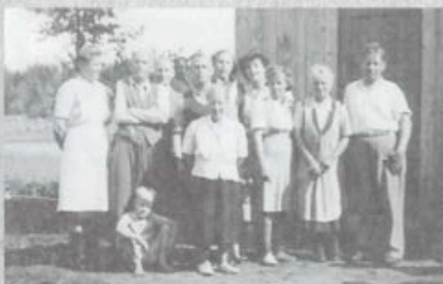
Kesäkoti Koivulan juhlaväkeä.