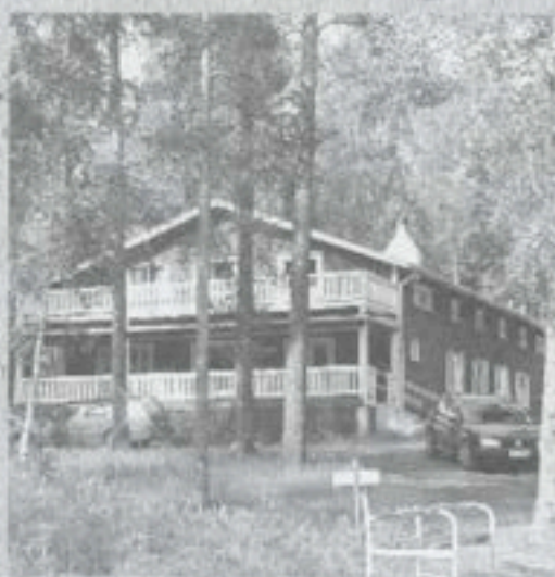
Aitoranta. Alla kuva Näsi-järven rantamaisemasta.