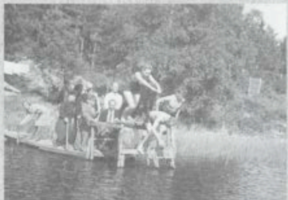
Yhdistyksen vuokrakesäkodilla Työläjärvellä 1943 pidettiin liiton uimamestaruuskilpailut.