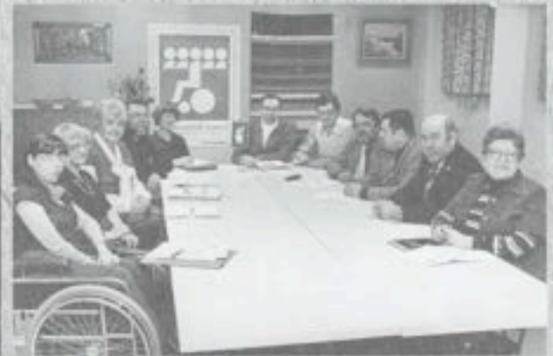
Yhdistyksen johtokunnan kokous.