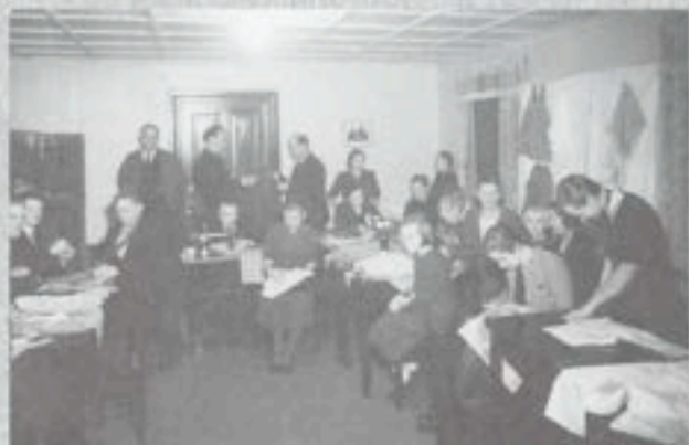
Myyjäisten valmistelua vanhassa puutalon kerhohuoneessa.