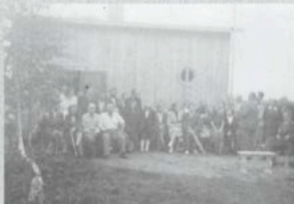
Yhdistyksen ensimmäinen oma kesäkoti Koivula sijaitsi Ylöjärvellä. Paikka myytiin vaikean sijaintinsa takia ja tämän jälkeen ostettiin Aitoranta.