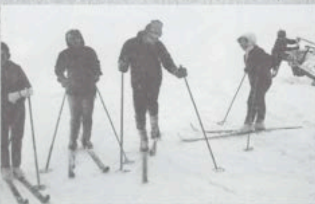
Yläkuvassa hiihtotapahtuma Näsijärvellä. Alakuvassa yhdistyksen opintokerholaisia, jotka toimittivat mm. omaa lehteä.