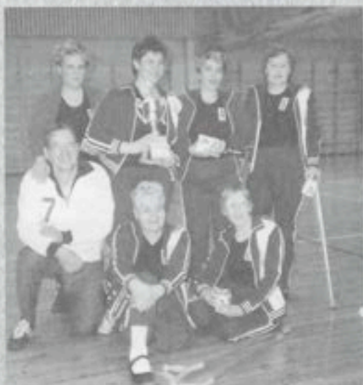
Istumalentopallon edustusjoukkueemme pelaajia 1980-luvulta.