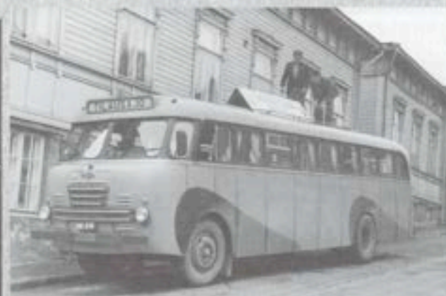
Yhdistysväki lähdössä Jyväskylään retkeilypäiville.