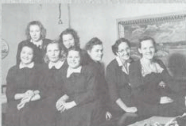
Yhdistyksen ompelimon naisväkeä 1940-luvulla.