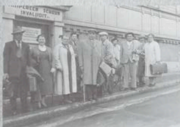
Retkeilypäiville lähtijöitä yhdistyksen toimitilojen edessä.