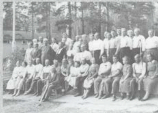
Yllä Tanskalainen orkesterivierailu ja veteraanien leiri. Alla Unikeonpäivän vesiherätys. Alaoikealla Kirstinpäivän viettoä Aitorannassa. Aitoranta on ollut vuosien varrella useiden juhlien pitopaikka.