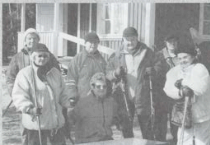
60 ja risat -kampanjaan osallistuneita.

Yhdistyksen koripalloilijat ovat järjestäneet kansainvälisiä koripalloturnauksia, johon vieraita on tullut aina Espanjasta asti. Myös Aitorannassa on ollut vierailemassa mm. istumalentopallojoukkue Saksasta.