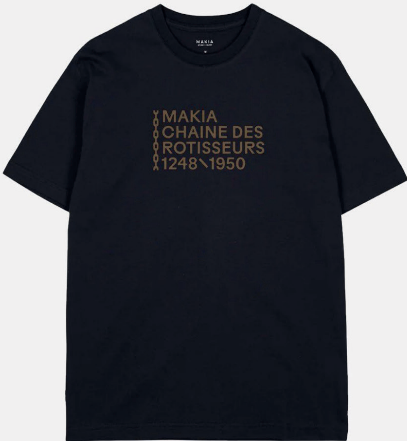
Chaîne des Rôtisseurs Finlande toteutti vuonna 2024 yhteistyössä Makia Clothingin kanssa rajoitetun erän laadukkaita tekstiilejä.