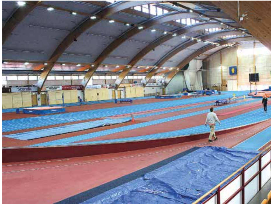
■ Sätträ Halli