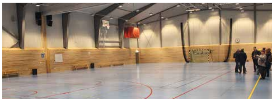
■ Palloiluhalli sisältä.

Olosuhdeseminaarin tutustumiskohde oli tänä vuonna Tukholmassa sijaitseva Sätträ-yleisurheiluhalli ja sen ympäristön muut liikuntatilat. Liikuntatiloja hallitsee Tukholman kaupunki, ja maan yleisurheiluliitto vastaa käytöstä sekä ylläpidosta.