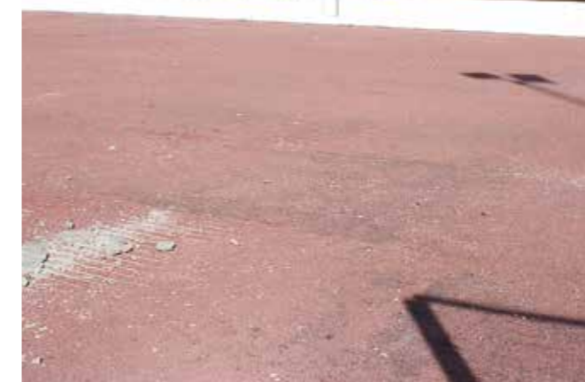
■ Jääkiekkokaukalo ja Palloiluhalli