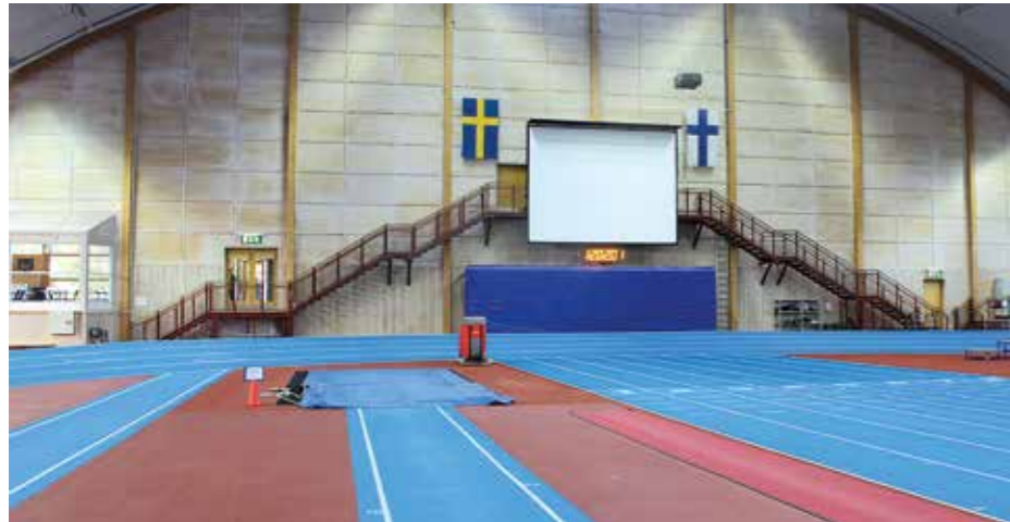
■ Suomalaisia vieraita kunnioitettiin liputuksella.