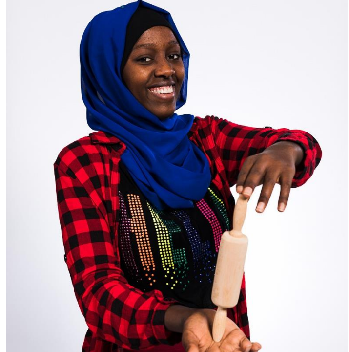
Sokorey, 4H-yritys Mocca & Samosa