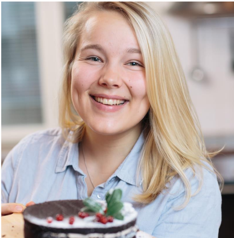
Annika 4H-yritys Katastrofigastronomi