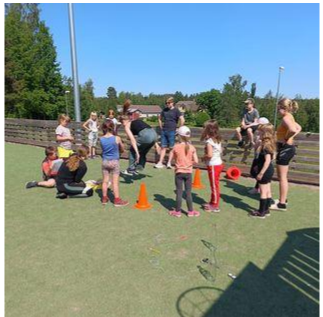
Jäppilän kesäleiri kesäkuu 2023