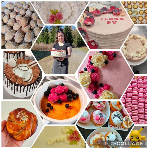
4H-yrittäjä Apuni Lähelläsi