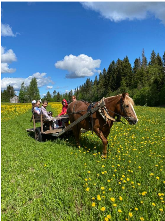
Vilhulan heppakerhon päätös kevät

Pieksämäen Seutuopisto Pieksämäen Urheiluautoilijat ry. Pieksämäen Yrittäjät Talli Ryökäle Spesia, Pieksämäki Step koulutus, Pieksämäen kampus Suomen 4H-liitto Suomen Metsäsäätiö Suomen Metsästäjäliitto Suomen Riistakeskus Suomen Vapaa-ajankalastajien Keskusliitto Suur-Savon Osuuspankki Taito Itä-Suomi Teittilän Talli Yara Suomi Veej` jakaja ry. 4H-nuorten vanhemmat ja huoltajat 4H-yhdistykset: Yhteistyöalue Keski-Suomi ja Etelä-Savo