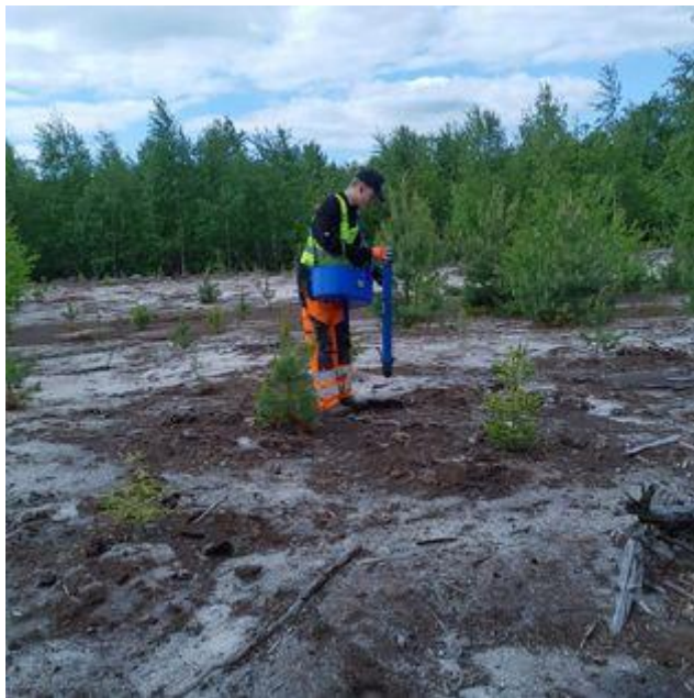
Taimiteko täydennys istutus kesäkuu 2023

Nuoret osallistuivat erilaisiin työtehtäviin mm. siivous, pihapalvelu, kesäkerho- ja leiriohjaus, taimiteko, virikepalvelu, luonnontuotteet kehittämishankeen opetusvideoiden teko ja sosiaalisen materiaalin teko.