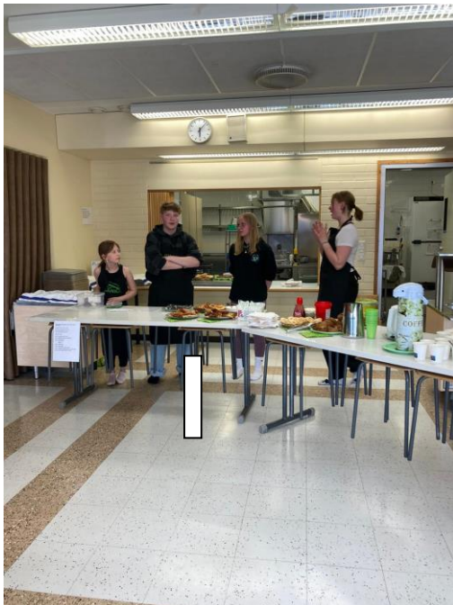
Virtasalmen safkasankari kahvio