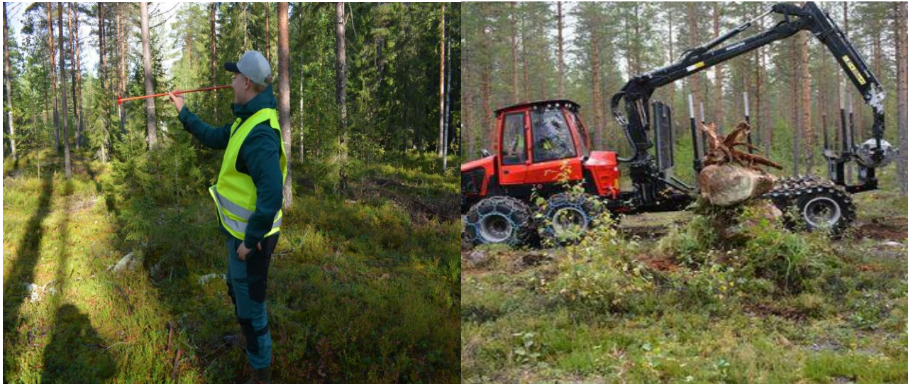
Metsäpäivä Hiekanpään yläkoulun 8-luokaklisille Pieksämäellä

Koululaisten metsäpäivä järjestettiin Hiekanpään yläkoulun 8-luokille 6.9.2023 yhteistyössä Suomen metsäsäätiön, Metsähallituksen, Metsäkeskuksen, Esedu Metsäopetus Pieksämäki, Metsä Groupin, UPM metsä ja Pieksämäen Riistanhoitoyhdistyksen kanssa.