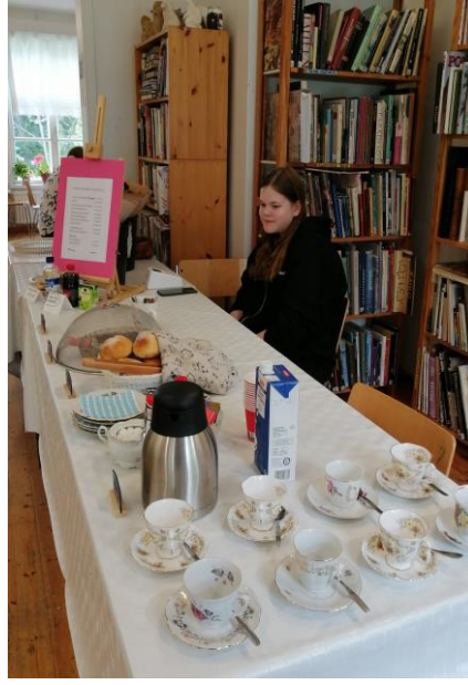
4H-yrittäjä Riksun Herkut