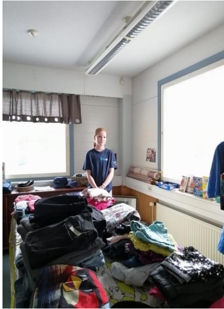
4H-yrittäjä Pinjan putiikki

Valtakunnalliseen 4H-yrittäjäkilpailuun osallistui viisi 4H-yrittästä: Apuni Lähelläsi, Kissapuron palvelut, Riksun Herkut, Tmi Roni, VT Piha ja Kone.