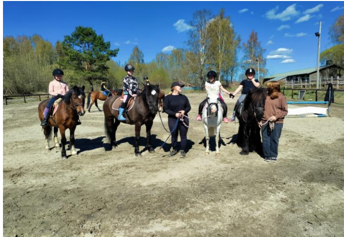
Vilhuan heppakerho kevät 2023