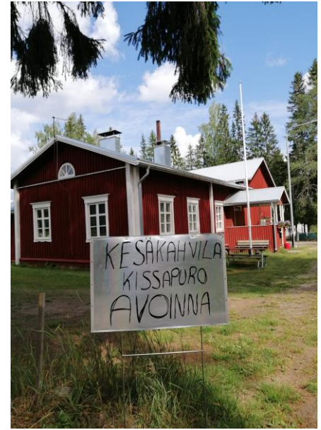
4H-yrittäjä Kissapuron palvelut