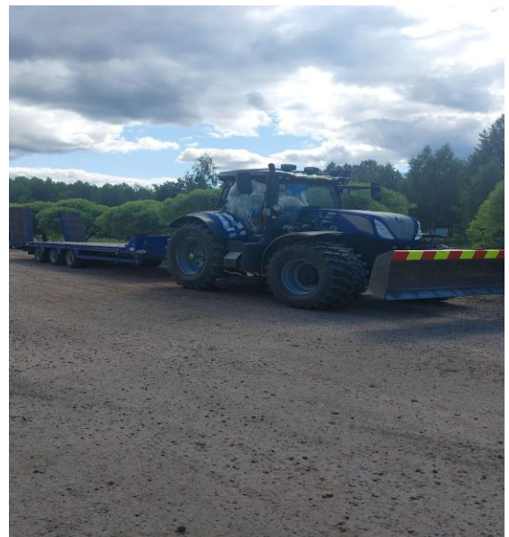
4H-yrittäjä VT-Piha ja kone