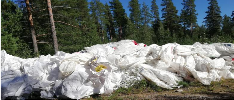
Reilu Teko säkkikeräys

Metallinkeräys metallinromua kerättiin 27180 kg.