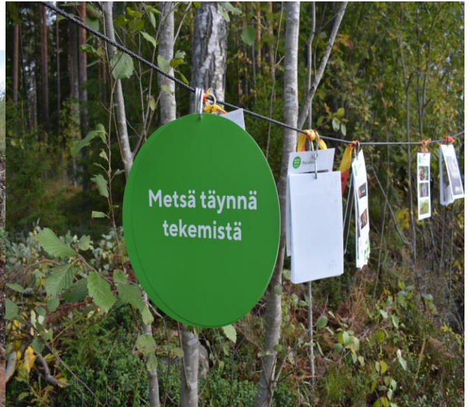
Metsä Group metsäpäivä Kangasniemellä