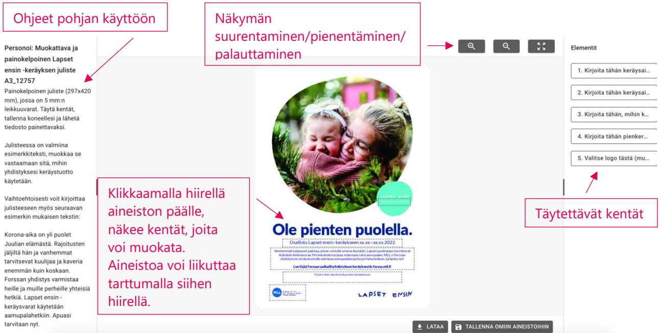
Kuva 4. Näkymä, jossa aineistoa muokataan.

Elementit-palstassa olevien täytettävien kenttien tekstin saa kokonaan näkyviin viemällä hiiren tekstin päälle. Klikkaamalla elementtiä, saa auki kohdan, jonka voi muokata. Yläpalkissa on työkaluja, joilla voi muuttaa esimerkiksi tekstin paksuutta, mutta lähtökohtaisesti pohjat on ajateltu toimivan niin, ettei niin tarvitse tehdä muotoiluja. Kun kaikki kentät on täytetty ja aineisto on valmis, klikkaa Lataa ja valmis tiedosto tallentuu koneellesi. (Kuva 5).