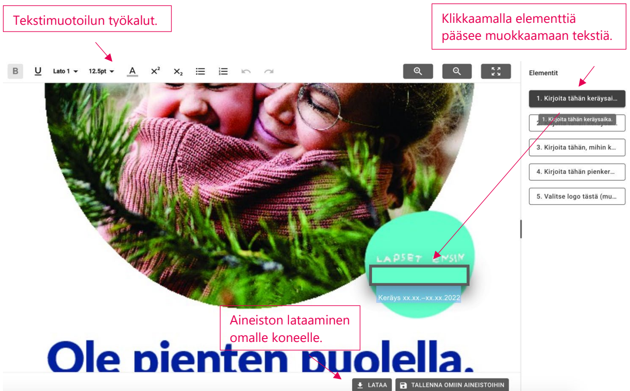
Kuva 5. Tekstikenttien muokkaaminen, tekstin muotoilu ja aineiston lataaminen.

Elementit-palstassa olevien täytettävien kenttien tekstin saa kokonaan näkyviin viemällä hiiren tekstin päälle. Klikkaamalla elementtiä, saa auki kohdan, jonka voi muokata. Yläpalkissa on työkaluja, joilla voi muuttaa esimerkiksi tekstin paksuutta, mutta lähtökohtaisesti pohjat on ajateltu toimivan niin, ettei niin tarvitse tehdä muotoiluja. Kun kaikki kentät on täytetty ja aineisto on valmis, klikkaa Lataa ja valmis tiedosto tallentuu koneellesi. (Kuva 5).