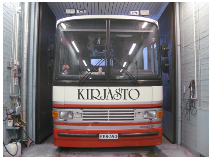
Sodankylän kirjastoauto Aulis 20 v.

Kirjastoautoon kannattaa asentaa pyörätuolinostin, jonka avulla myös liikuntakyvyttömät ja huonosti liikkumaan pääsevät henkilöt saavat tilaisuuden asioida itsenäisesti autossa. Tämä laajentaa kirjastoauton käyttömahdollisuuksia ja sen asiakaskuntaa. Kunta huomioi yhä paremmin asukkaidensa palveluntarpeet. Kahden pätevän kuljettajan avulla auton käyttöastetta voidaan nostaa mm. aamu- ja iltavuoroajat tulevat mahdollisiksi.