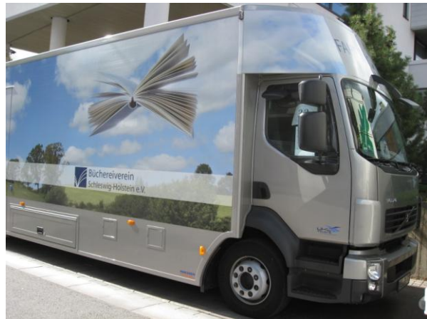
Saksan Sleswig-Holstein oli hankkinut kuorma-auto tyypisen kirjastoauton.