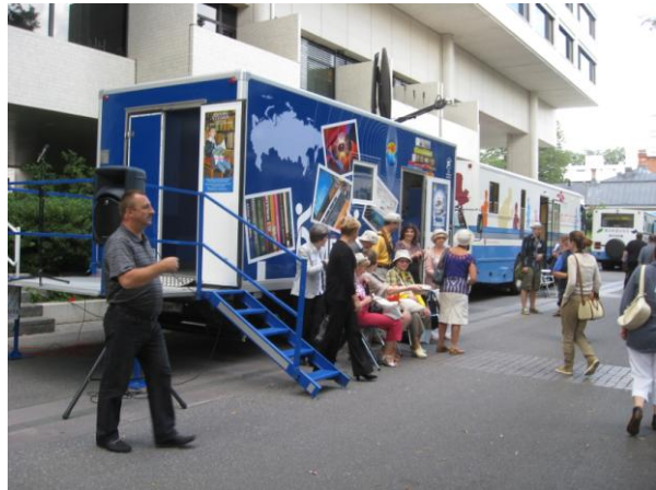
Venäläisessä pienoiskuorma-auto kirjastoautossa oli myös takana esiintymislava.