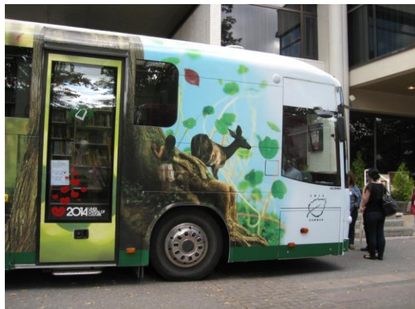
Ruotsalainen Uumajan linja-autotyyppinen kirjastoauto valittiin kuitenkin vuoden 2011 kirjastoautopäivien kauneimmaksi. Eikä ihme! Tätä äänestin itsekini. Kirjastoauton suunnittelussa oli mukana Uumajan yliopisto. Myös sisätilaratkaisuissa näkyi taideopiskelijoiden käden jälki.