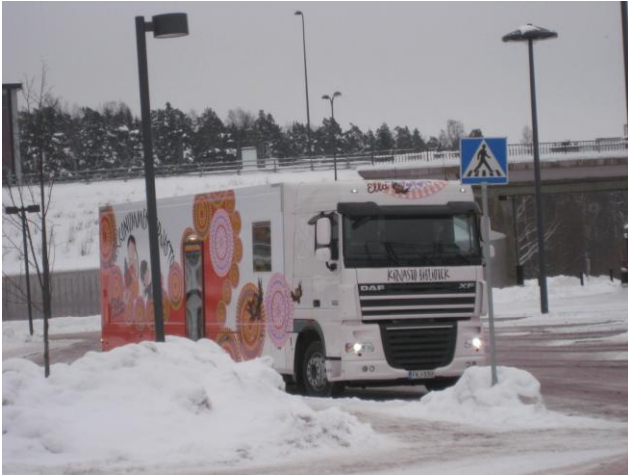
Kirkkonummen kirjastoauto "Ella"

Suomen ensimmäinen kuorma-auto tyyppinen konttiauto valmistui vuoden 2012 alussa Kirkkonummen tilauksesta. Heti perään Mäntsälä sai oman konttiautonsa maaliskuussa. Nämä autot on valmistanut EKT M. Vähämaa Oy Seinäjoelta ja niissä on DAFin kuorma-auto alusta. Suomessa ei ole vielä muita valmistajia konttiautoille.