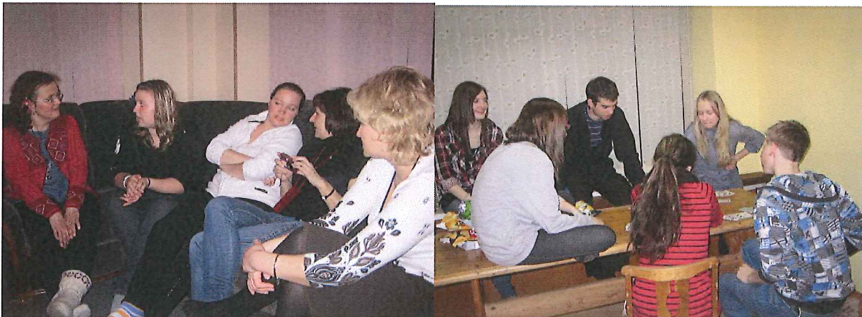
Keskusteluja... ja vähän kansainvälisiä pelejäkin