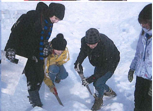
Patikointia, hienoja maisemia, kiviä ja lunta