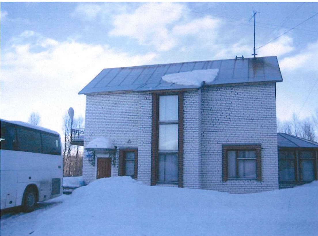
...Ja heti kaupunkiin paluun jälkeen