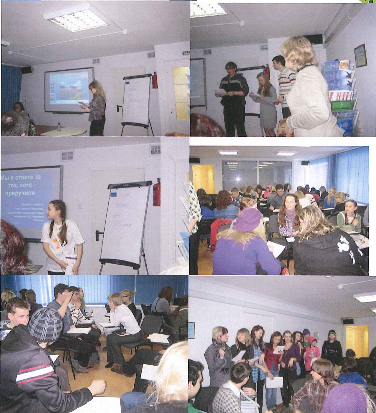
Seminaariesityksiä ja ryhmätöitä