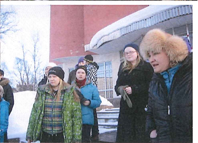
Kaupunkierroksella oppaiden kanssa