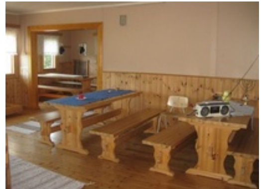
Yhteiskäytössä oleva ruokasali

Päärakennuksen huoneita ja mökkejä on yhdistyksemme jäsenien mahdollista varata omaan käyttöönsä korkeintaan viikon ajaksi. Mökin tai huoneen voi varata korkeintaan viikoksi käyttöönsä ja korkeintaan kaksi majoitustilaa yhtä aikaa. Mökkien tai huoneen vuokra on 10€/vrk ja se maksetaan pankkisiirrolla. Majoitusvuorokausi on klo. 12.00 - 12.00.