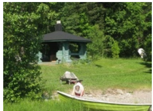
Kotojärvellä on myös vene