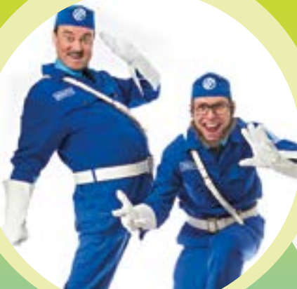
Malti ja Valtti