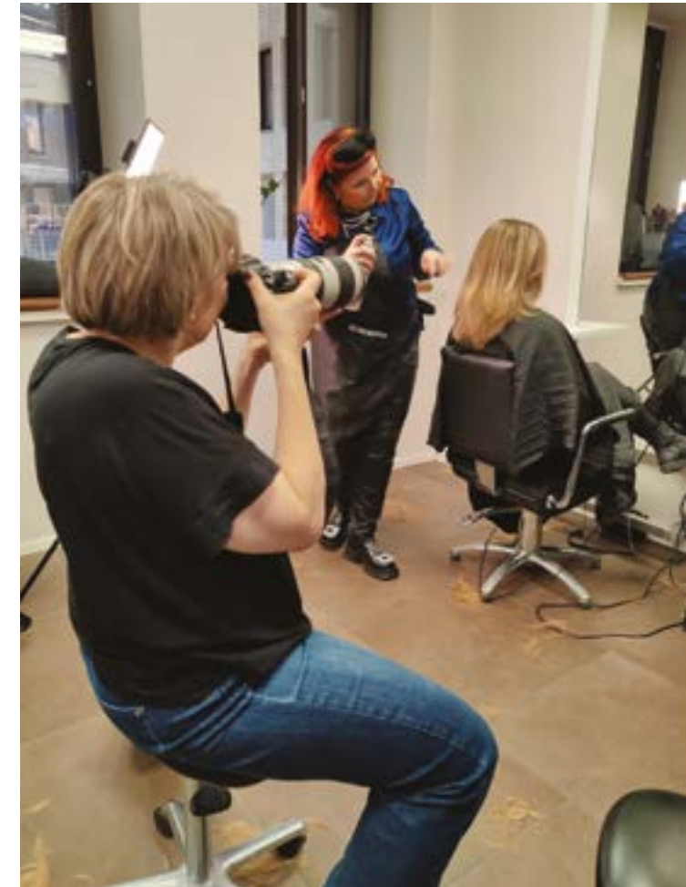
Sydämellinen ja lämmin kiitos Kympin Lapset, Salon Klipsi ja Sokos Helsinki

Kun hiukset ja meikki oli kunnossa, oli vuorossa VIP kierros myymälässä. Minulle tuotiin ostoskori ja pääsimme opastetusti kiertämään myymälän läpi tuote kerrallaan. Oli uskomaton tunne, kun kaikki oli vain minua varten. Myymälän asiantuntija tiesi täsmälleen, mitä minä ja ihoni kaipaavat ja keräsi sen hyllystä koriini. Ajatukseni eivät ensimmäistä kertaa vuosiin päässeet kertaakaan lipsahamaan siihen, mitä