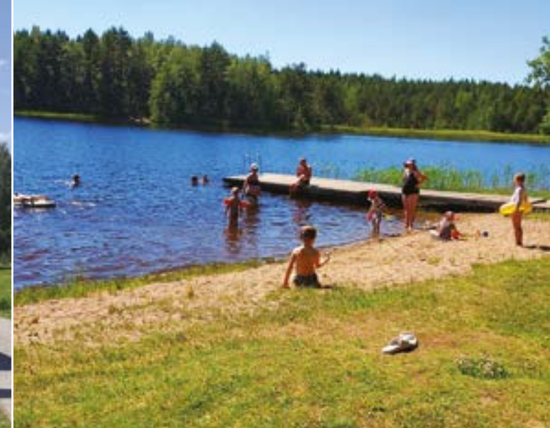
Uintiretket olivat lasten mielestä ihan parasta

Viikon odotettu kohokohta oli tietysti Iltamat. Pienet ryhmät esittivät huolellisesti suunnitellut ja hienosti toteutetut ohjelmanumeronsa. Yleisö sai nauttia mm. pikku ratsastajatyttöjen esityksestä, korkeatasoisesta modernin tanssin soolosta (kiitos, Senja!),