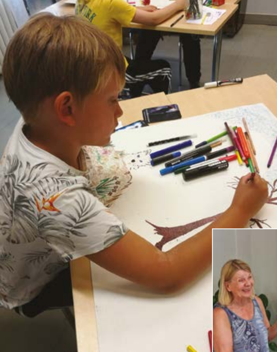
Voimaeläinteoksissa yhdistyi taide ja terapia