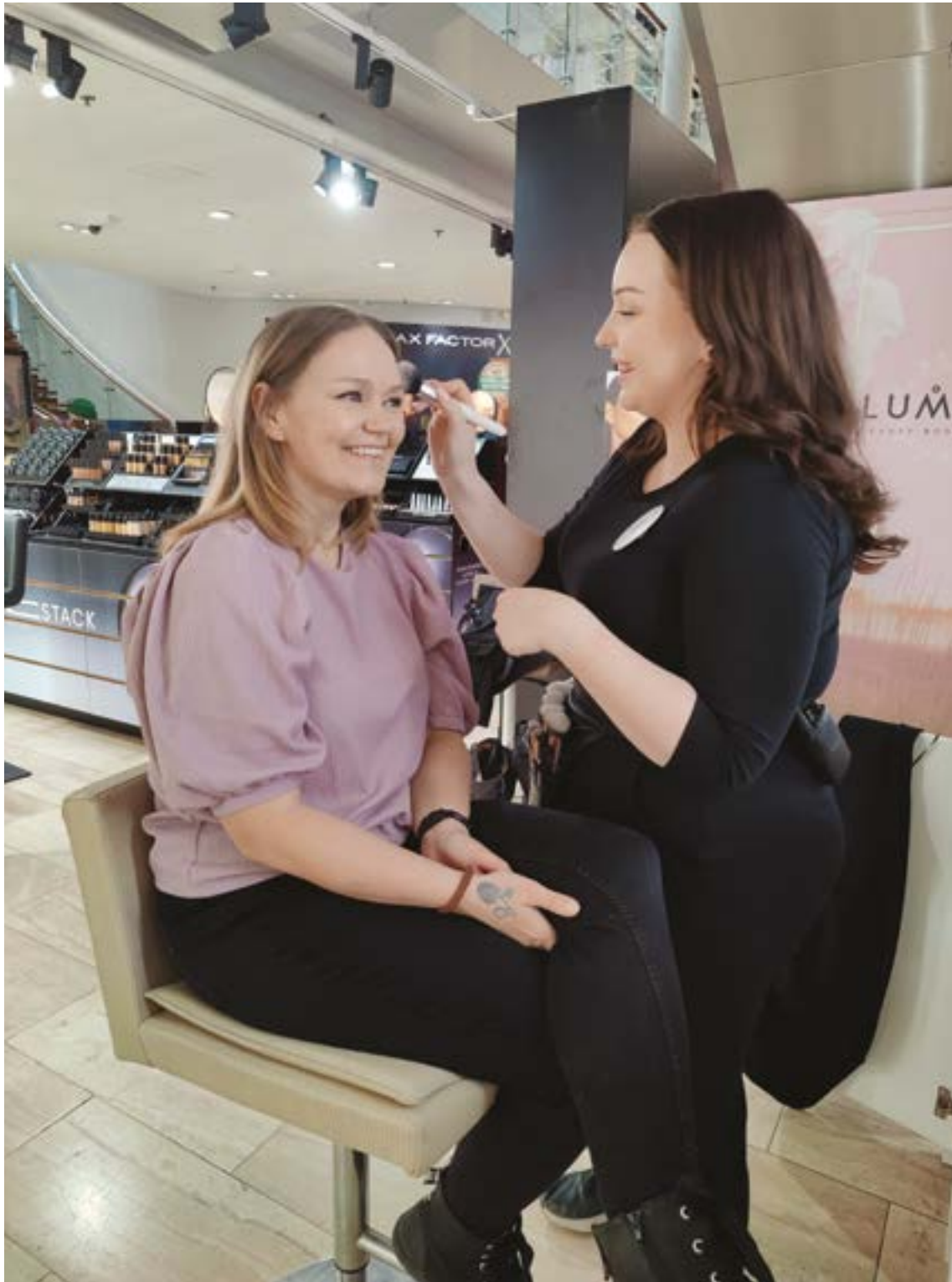
Kampaajan jälkeen hemmottelu jatkui ihonhoidolla ja meikkauksella