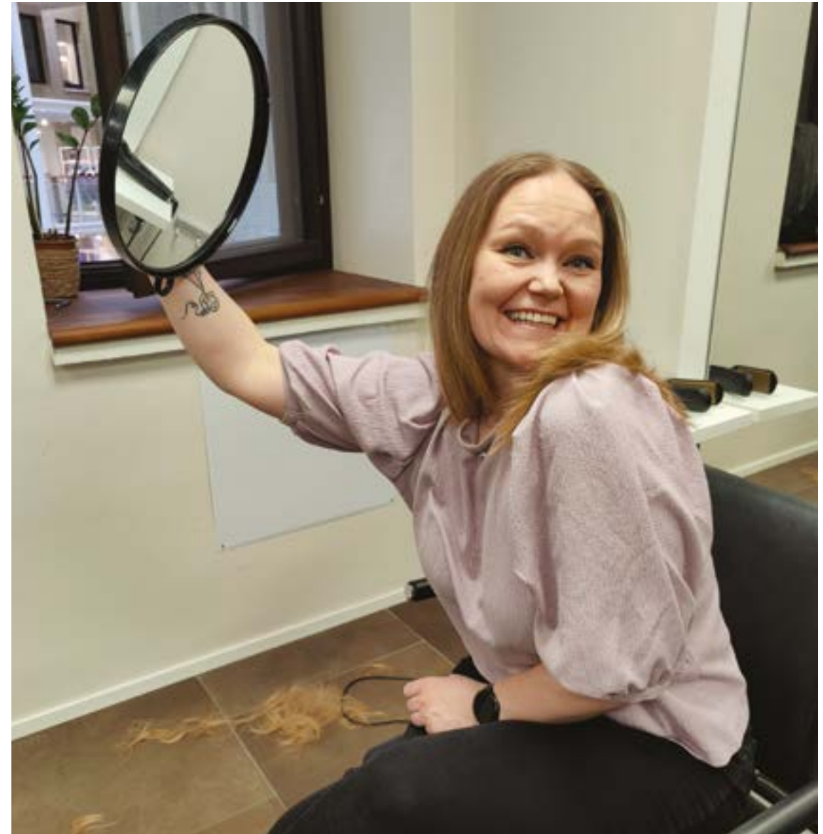
Näin voisi aloittaa jokaisen päivän!

Teksti: Taina Söderholm