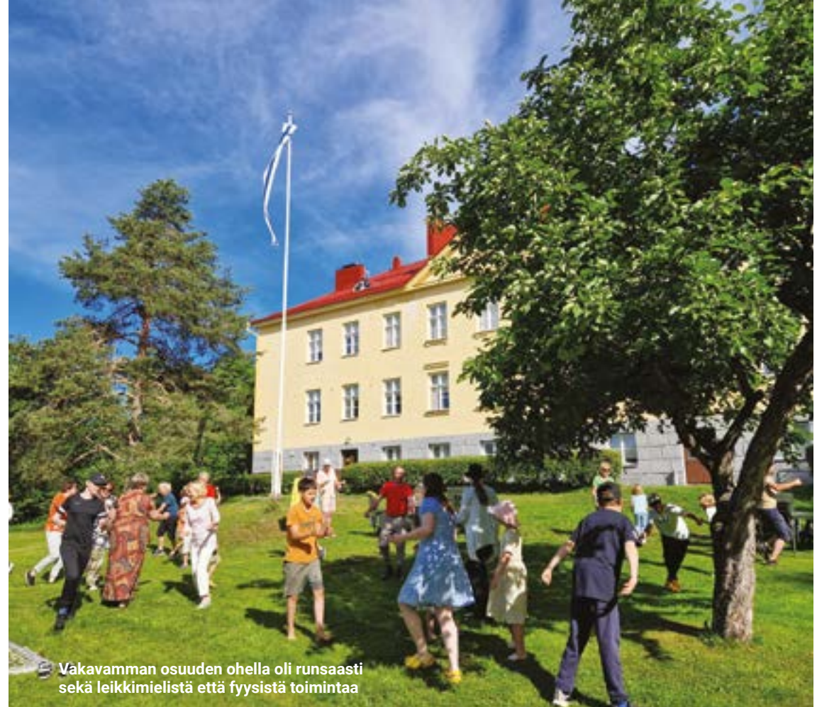
Vakavamman osuuden ohella oli runsaasti sekä leikkimielistä että fyysistä toimintaa