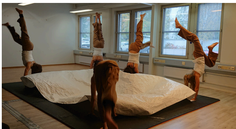
Pukinmäen taidekoulun oppilaiden esitys: ote näytelmästä “Pikku Prinssi”.

Noin 75% ETOL ry:n jäsenoppilaitoksista osallistui syyspäivään: 14 paikan päällä ja 6 etänä, yhteensä 20 jäsenkoulua. Osallistujamäärä kasvoi edellisestä vuodesta 42%.