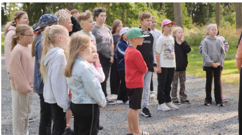
Teatterikoululaisten kesäpäivä, Pieni Teatterikoulu