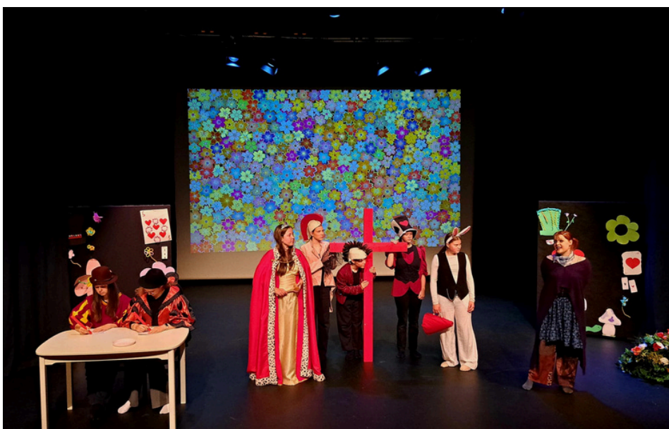
Kuva: Forssan Pieni Teatterikoulu, Wahren-opisto

ETOL ry antoi lausunnon lakimuutoksen ehdotuksesta lausuntopalvelussa ja kehotti myös jäseniään lausumaan asiasta omat näkemyksensä.