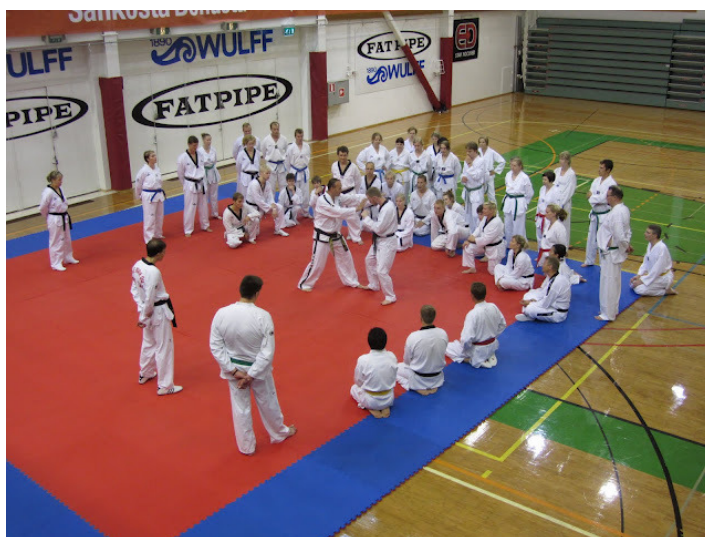
Taekwondo Festival Helsingissä 6.8.