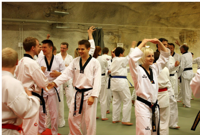
Sim Uu –leiri Tampereella 14.-15.5.