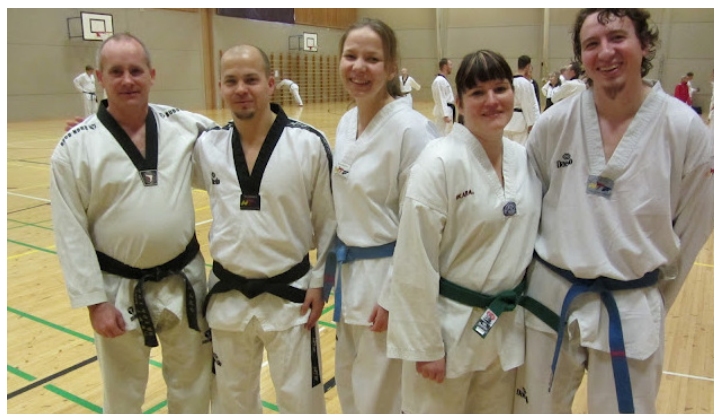
Sim Uu –leiri Kouvolassa 21. 23.10.