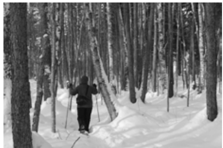
Rannan tervaleppäkorvessa on oma tunnelma.

Apajalahden luontopolkuun voi tutustua etukäteen osoitteessa: http://www.vaelus.info/reitit/apajalahden-luontopolku/