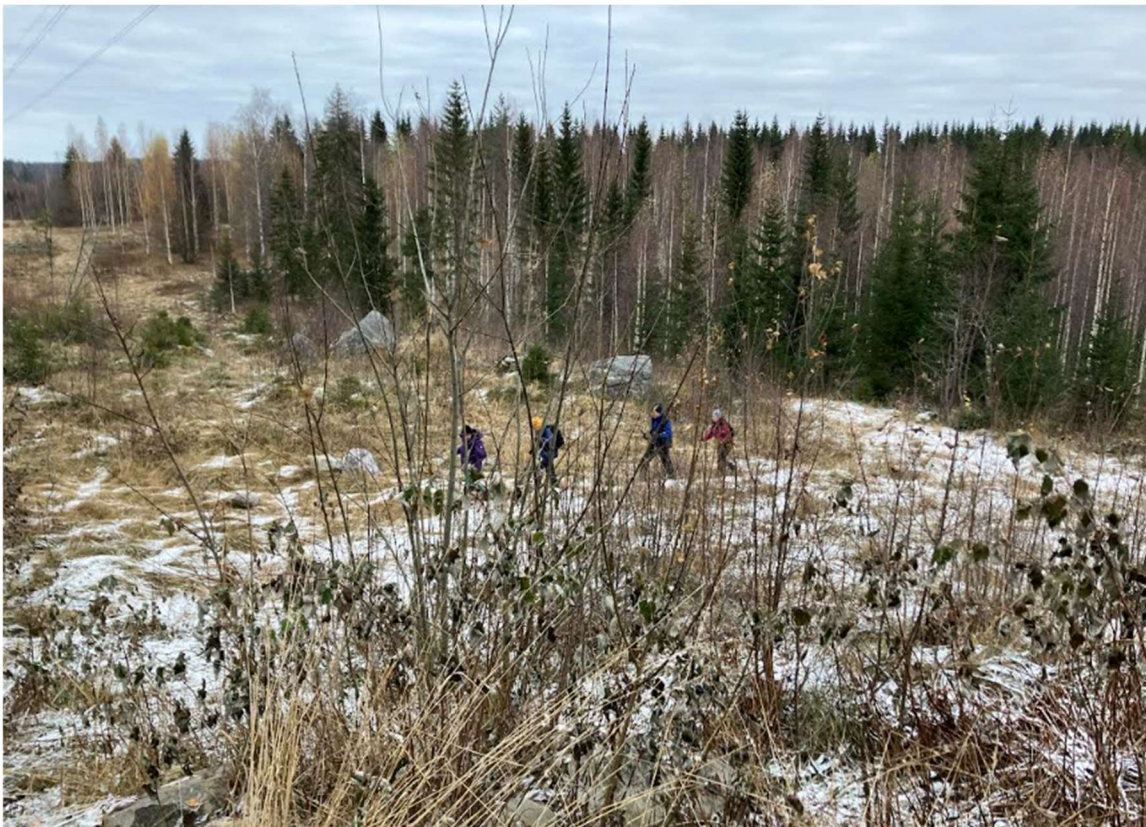
Paluureitti kulki sähkölinjaa pitkin.