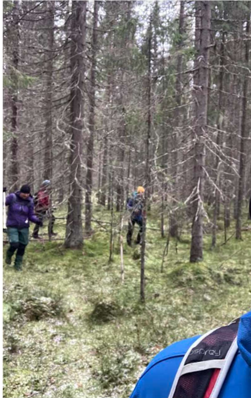
Mäkisen maaston jälkeen samoiltiin "polutonta polkua" - onneksi reittimerkinnät olivat vielä tallella (jos toki tarkkana piti paikka paikoin olla).