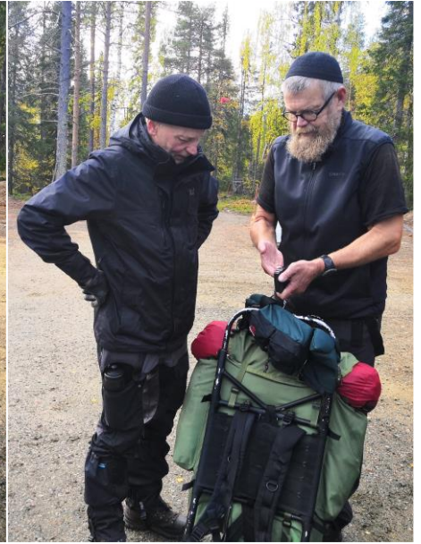
Olemme kovasti yrittäneet keventää kuormiamme. Lopussa melkein kaikilla alle 15kg.