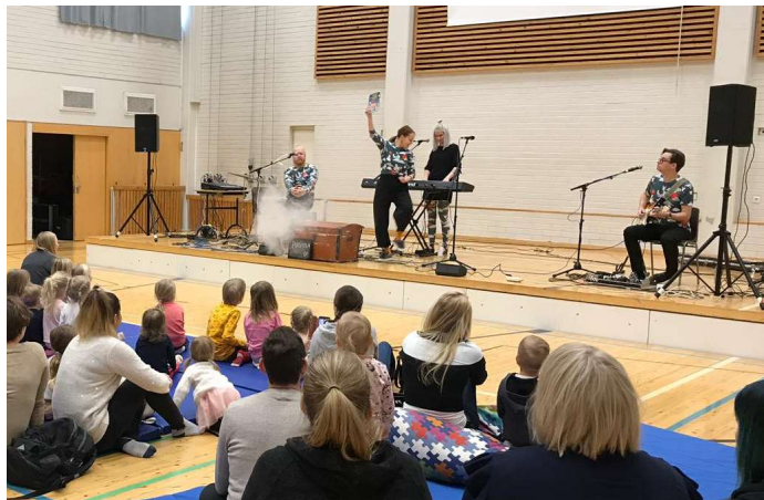
Käpylehmä-orkesteri Nurkalla 25.1.2020.

Muutoin kevät 2020 olikin monin tavoin poikkeuksellinen . Ei varmasti kukaan osannut etukäteen aavistaa, mitä oli tuleva. Uuteen, poikkeukselliseen arkeen sopeutuminen vaati paljon niin yrityksiltä, yhdistyksiltä kuin aivan tavallisilta suomalaisilta. Perheiden arki muuttui, kun kouluissa siirryttiin etäopetukseen, pienten lasten kotihoitoa suositeltiin ja myös monet aikuiset jäivät kotiin joko etätyöskentelemään tai esimerkiksi lomautuksen vuoksi. Harrastuksetkin jäivät tauolle ja aikaa oli vietettävä entistä enemmän oman perheen kanssa, niin hyvässä kuin pahassa.