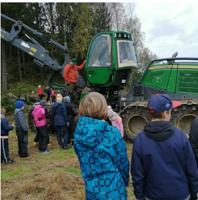
Kuva: Auran Kirkonkulman oppilaita Suomen Metsäsäätiön metsäkuljetusmatkalla moto-kohteessa ja Teijolla 10.10.2023

Kerhotoiminnan lisäksi nuoria osallistuu satunnaisesti leireille, metsäkuljetusmatkoihin, kilpailuihin, koulutuksiin, kouluyhteistyöhön, hanketoimintaan tai työllistyy 4H-yhdistyksen kautta. Heitä ei ole laskettu tilastojen mukaisiksi 4H- jäseniksi eikä muiksi säännöllisesti toimintaan osallistuneiksi nuoriksi.