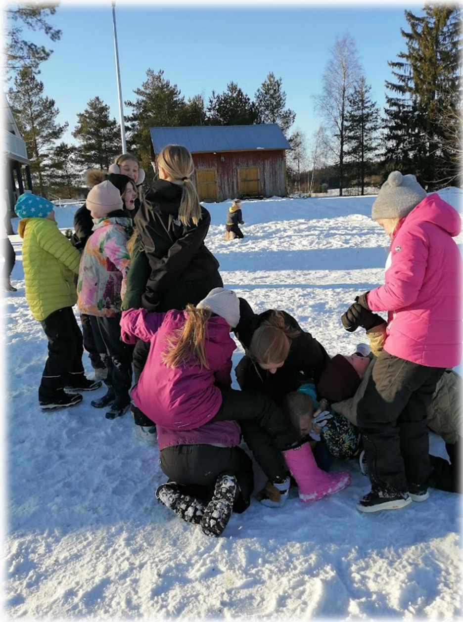
Kuva: Luontoleirillä Marttilan Eräveikkojen majalla 31.3.-1.4.2023