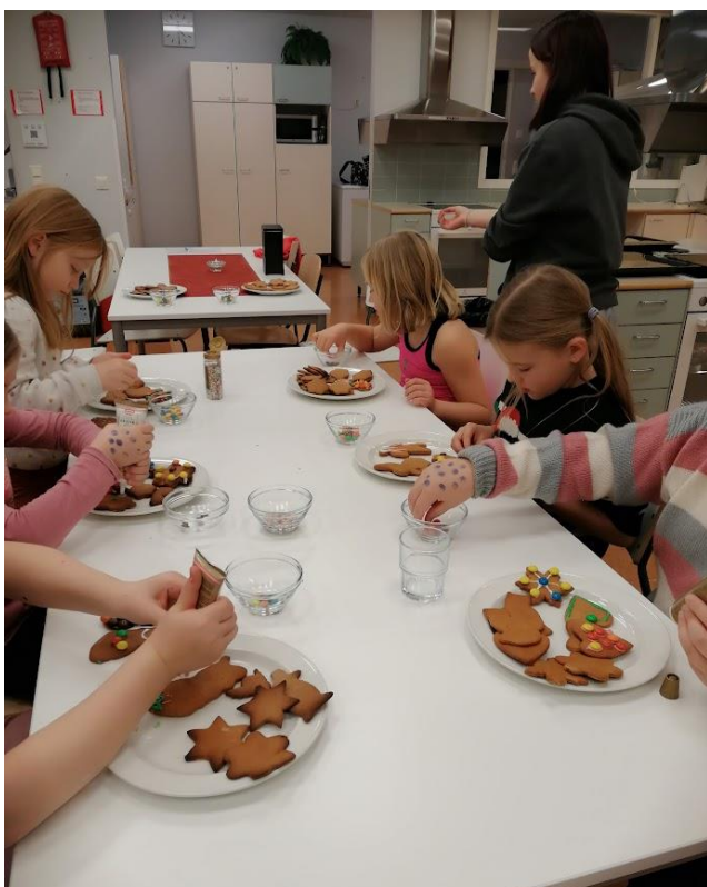
Kuvat: Kosken 4H-kokkikerhoon kalapihvit, Haverin 4H-ponikerhon retki, Marttilan kokkikerhossa siilin valmistaminen, Heikinsuon 4H-kerhossa jouluaskartelua ja Auran Perjantaikerhossa joululeivontaa ja piparien koristelua sekä Suomen 4H-liitto 95v -kakkukisaan Kyrön 4H-kokkikerhon luomus