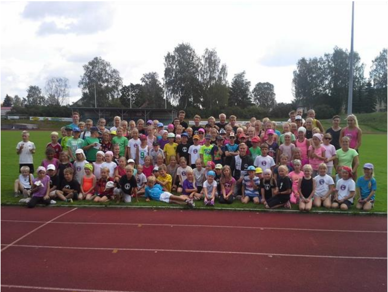
Tarmon yleisurheilukoululaiset yhteispotretissa kesäkaudella.

Seura pyrkii kouluttamaan toimitsijoita aina vallitsevien olosuhteiden mukaisesti. Erityisesti koulutusta tarjotaan loppukevällä / alkukesällä kisatoiminnan alkaessa.