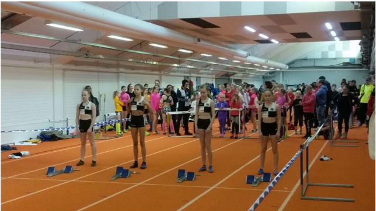
Tarmon sprintterityttöjä Lahden Pikajuoksucupissa (talvi 2016).

Erityisliikuntaryhmä voidaan perustaa tarvittaessa.