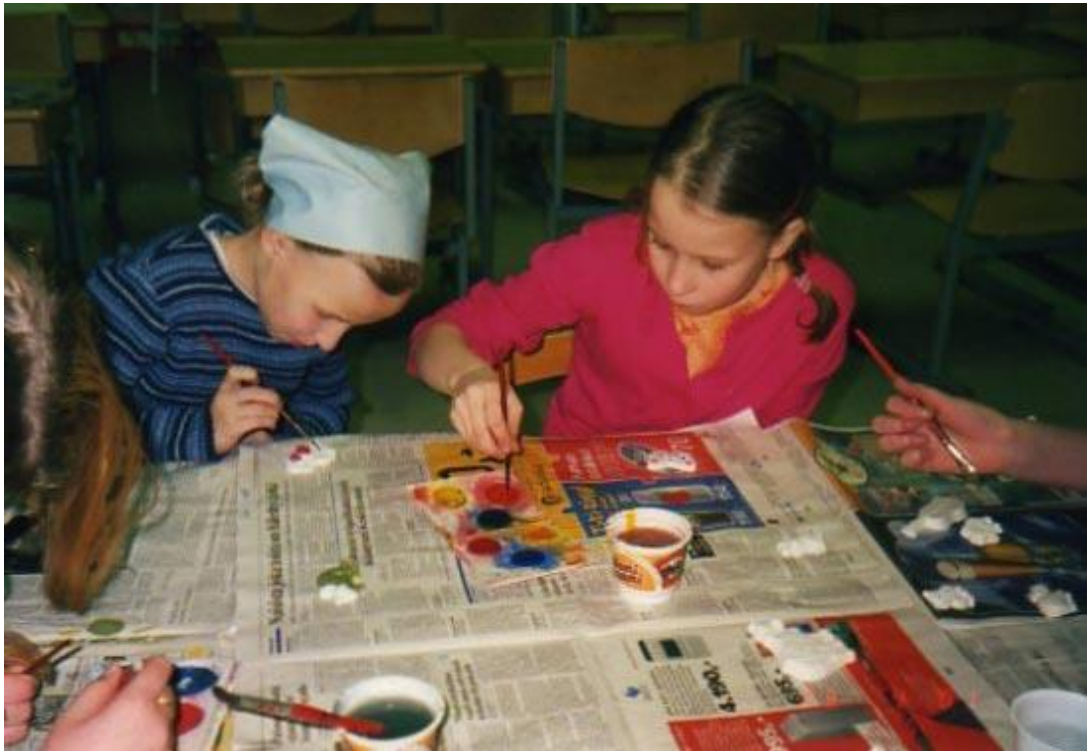
Kuva 6. Kuikan kerholaiset maalamassa kipsitöitä keväällä 2001.

rinnalle syntyi yhdistyksessä myös erilaisia tiimejä kuten dogsitter-tiimi dogsitter-toi-