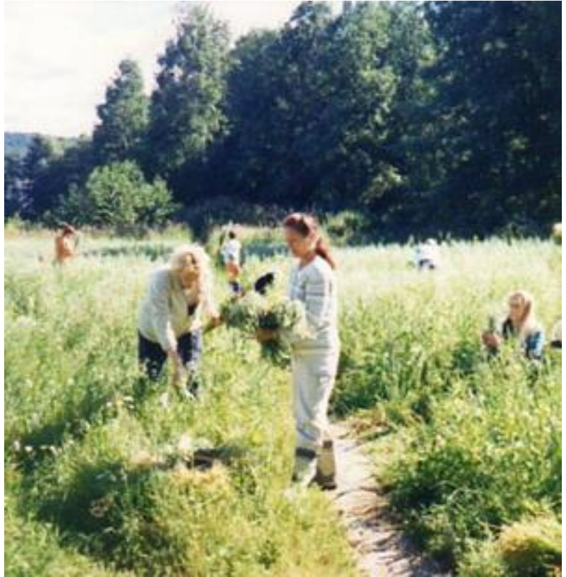
Kuva 9. Kesällä 2001 tehtiin yhteistyötä kaupungin puistotoimen kanssa, kun Survo-Korpelan tilan maisemapellon viljely kuului 4H-yhdistykselle.

Toinen merkittävä hanke on Tekemällä Oppimisen Keskus eli TOK-hanke, joka alkoi vuonna 2003. Kuokkalan kaupunginosassa sijaitsevalle Survo-Korpelan tilalle haluttiin perustaa vaihtoehtoinen oppimis- ja tekemisympäristö. Keskukseen on tarkoitus tarjota toimintamahdollisuuksia niin kouluille kuin muillekin ryhmille. Käytännössä keskuksessa tullaan järjestämään leirejä, kursseja ja pajoja. Se tarjoaa mahdollisuudet myös muun muassa kotieläinpihalle ja palstaviljelylle ja sitä kautta tukee yhdistyn yrittäjyyskasvatustehtävää. Tekemällä Oppimisen Keskukseen avajaisia vietetään syyskuussa 2006.