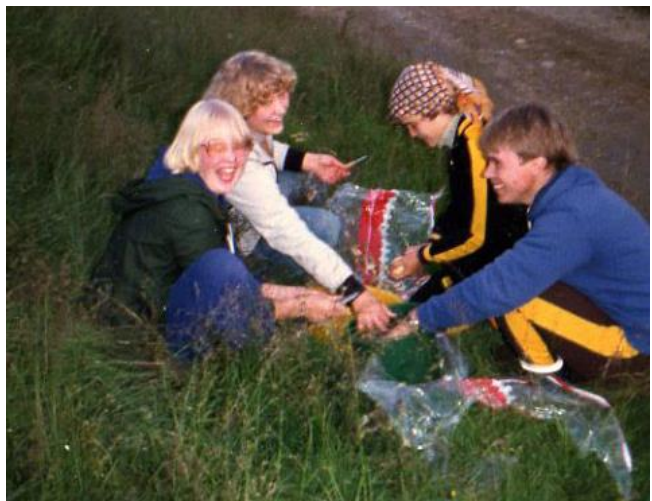
Kuva 2. Retki Pohjois-Norjaan keväällä 1979.

Harrastustoiminta jatkoi edellisellä vuosikymmenellä alkanutta kasvuaan. Sitä tehostamalla pyrittiin huomioimaan ne lapset ja nuoret, joilla ei ollut mahdollisuutta osallistua maataloustoimintaan. Heitä oli yhä enemmän, kun kerhoja perustettiin myös taajamiin. Kerholaisten keski-ikä myös laski vuosikymmenen loppulla ja nuorimmille koettiin sopivimmiksi juuri harrastustehtävät.