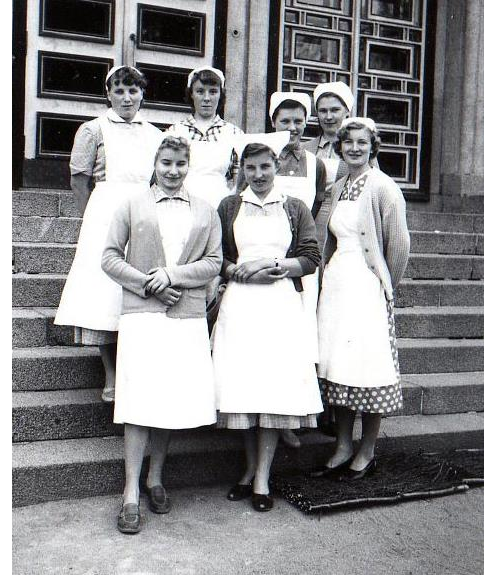
Kuva 1. Kotitalouskurssit olivat suosittuja 1950 ja 1960 -luvulla

Sodanjälkeiset vuodet, erityisesti 1950-luku, olivat kotiseutuaatteen aikaa. Sen myötä yhdistystoiminta alkoi viritä uudelleen. Maatalouskerhojen suosiota lisäsi myös pientilallisten määrän kasvu. Jyväskylän pitäjässä maatalouskerhotoiminta herätettiin henkiin vuonna 1956. Yhdistyksen virallisena nimenä oli edelleen Jyväskylän pitäjän maatalouskerhoyhdistys, mutta siitä käytettiin myös nimitystä Jyväskylän maatalouskerhoyhdistys.