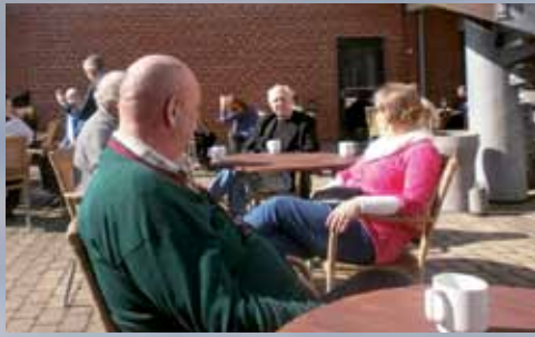
Kuvat: Karlsundens merinäköala taustana ja Iltapäivän tauko kurssikeskuksen terassilla