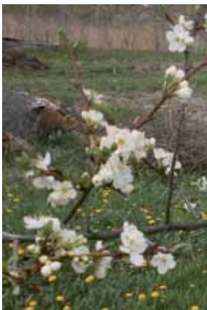
Sosiaalipalvelut: Työsuojeluvaltuutettu Ari Kaikkonen 1. varavaltuutettu Markku Itkonen 2. varavaltuutettu Sari Kuusipalo