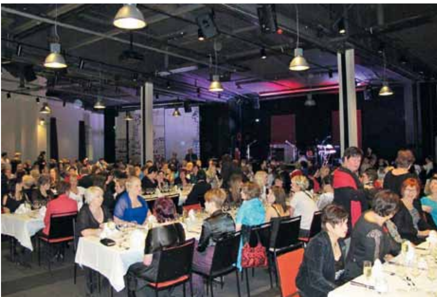
Aterian henkilöstöä 10-synttäreillä 6.2.2015 Tornihotellissa

Toimitusjohtaja Tampereen Ateria liikelaitos