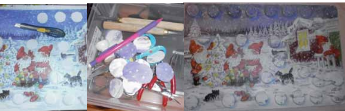
Joulukalenteri Maitotölkkin korkeista ja pöytätabletitä