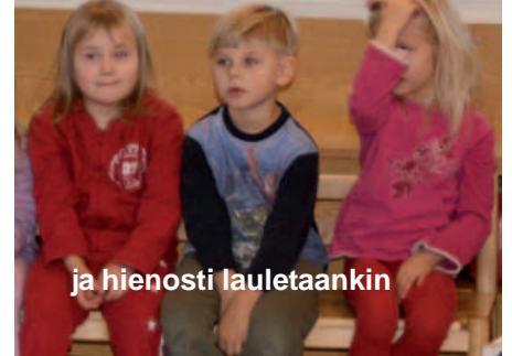
ja hienosti lauletaankin