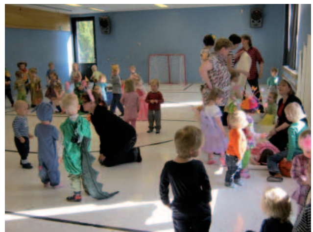
Liikunnan riemua ja hienoja naamiaisasuja