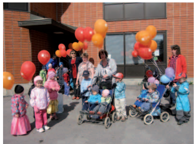
Nyt on leikit leikitty ja lähdevä on...

Teksti Paula Virolainen