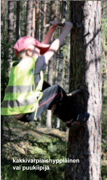
kakkivarpiaishyppiäinen vai puukiippijä