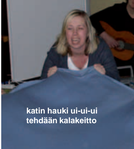
katin hauki ui-ui-ui tehdään kalakeitto