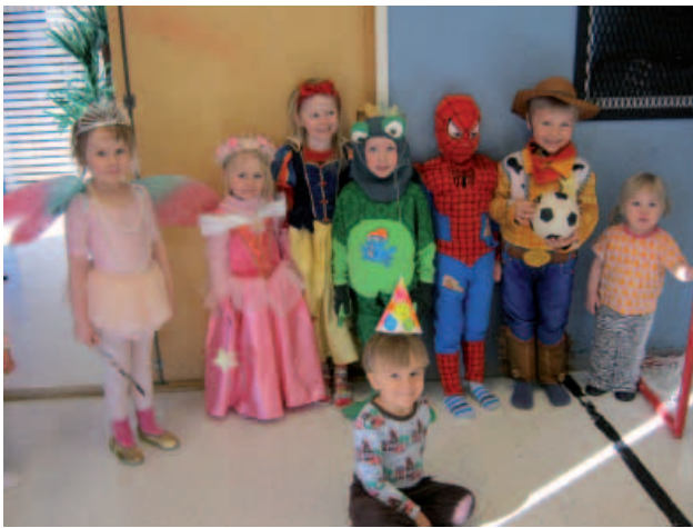
Jännittää hieman, kun juhlararssi jo soi...

Lapsilla oli hauskaa turvallisessa ympäristössä, silti hieman jännitti alkuun, kun kaikki olivat puukeutuneet rooli- tai juhla-asuihin. Juhlavasti lähdettiin liikkeelle juhlararssin soidessa. "Muotinäytös" sujui upeasti, kun samalla tutustuttiin ketä kaikkia oli paikalle saapunut Vappua juhlimaan.