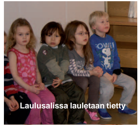
Laulusalissa lauletaan tietty