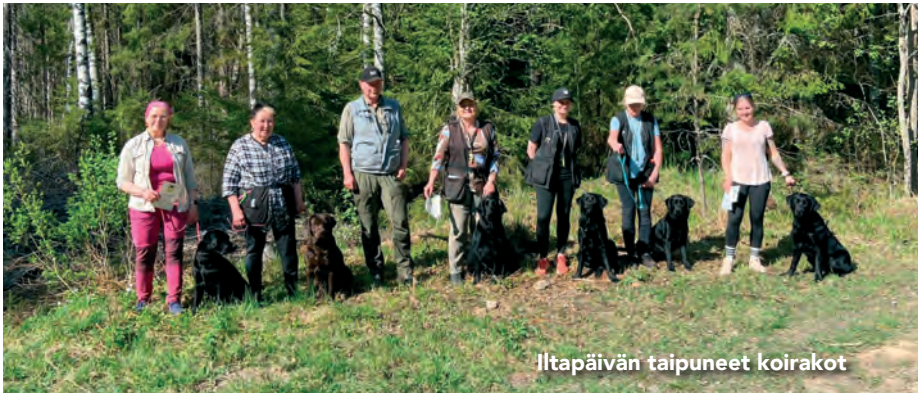
Iltapäivän taipuneet koirakot