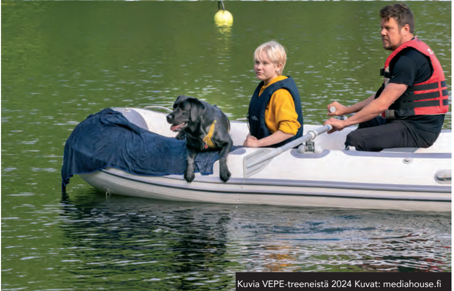
Kuvia VEPE-treeneistä 2024