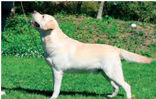
Follies Quito "Kito"