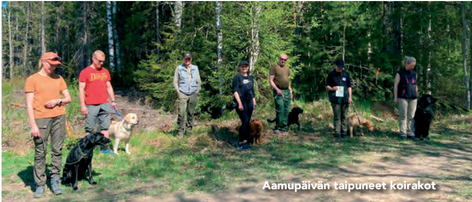
Aamupäivän taipuneet koirakot