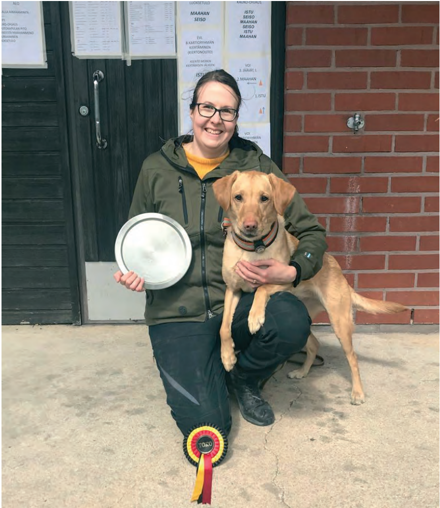
Haukkulautasen voittaja