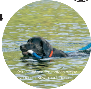
Koira vetää veneen rantaan hyppy veneestä

pisteitä 100, SOVE1, siirto ALO pisteitä 98, SOVE1, siirto ALO