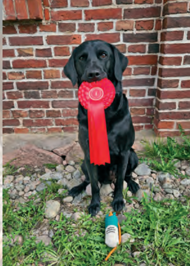
Capandus Irish Coffee "Hyde" AVO1