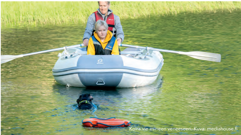
Koira vie esineen veneeseen.