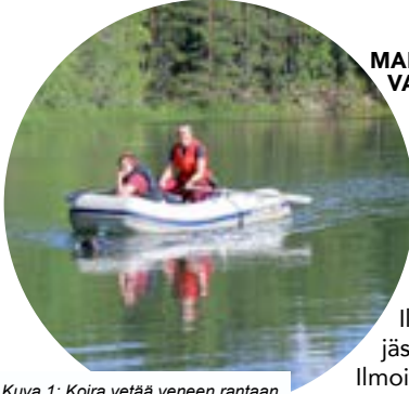
Kuva 1: Koira vetää veneen rantaan