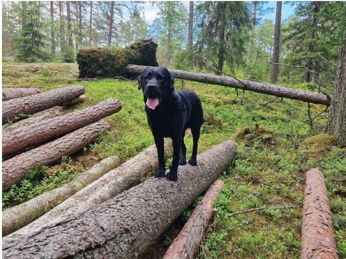
Tasapainoharjoittelua ja lihaskuntoilua

Maanantai, toukokuun 3. päivä oli päivä, jolloin meidän kesän suunnitelmat ja toiveet romahtivat. Aamulennkillä Into oli täysin normaali, mutta pari tuntia myöhemmin se alkoi oireilla täysin identtisesti verrattuna tammikuun oireiluun. Inton vasen takajalka kramppasi vartaloon kiinni, lisäksi koko takaosan lihaksisto oli täysin kramppissa. Poikkeuksena edelliseen kertaan oli, että Inton takaosa oli voimaton, velto, eikä Into oikein itsekään tuntunut hahmottavan takaosaansa. Arvasin jo, mistä on kyse ja itku nieleskelten soitin eläinlääkärille ja pyysin Intolle kiireellistä aikaa CT-kuvauksiin. Intoa hoitanut tuttu ortopedi lupasi ottaa Inton tutkittavaksi ylimääräisenä leikkauspäivänsä lomaan, joten Into pääsi vain muutamaa päivää myöhemmin CT-kuviin. Odotellessamme kotona