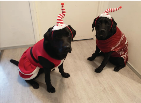
Saaga & Jade

Novascotiannoutaja.fi (2014) koirarunot http://www.novascotiannoutaja.fi/paeivaen-murinat/koirarunot/