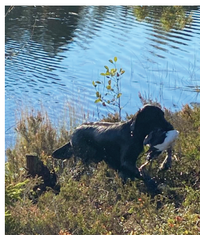
flatti Korven Akan Hanga