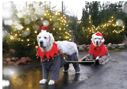
Mopo & Bemu