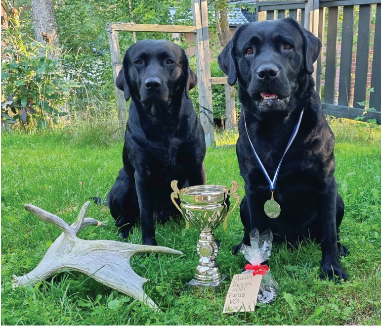
Into on mitali kaulassa ja "pikkuveli" Onni on vieressä

myös ollut ongelmia selän kanssa, sillä on todettu sydämen supistumisvajausta, sekä viimeisimpänä kilpirauhasen vajaatoiminta. Tämä vuosi on ollut käsittämättömän raskas niin monella tapaa, eikä todellakaan lainkaan sellainen, kuin olin suunnitellut. Tavoitteet, joita asetin tälle kaudelle, eivät ole toteutuneet. Tavoitteet murenivat molempien koirien kohdalla jo alkuvuodesta, mutta en olisi silloin osannut kuvitellakaan millaista taistelua ja painajaisia tästä vuodesta tulisikaan. Eikä se taistelu ole vielääkään ohi.