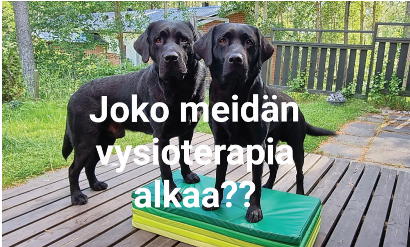
Vysioterapiaa Into ja Onni

sa tuomarin alkupuhuttelussa. Jos ei ole vielä käynyt selväksi, olen jokseenkin tunteellinen ihminen, ja jo pelkästään tuomarin alkupuhuttelu, jonka olen kuullut jo niin monia, monia kertoja aiemminkin, sai minut liikuttamaan. Ihan vain siksi, että koko alkuvuoden sairastelujen jälkeen olimme mukana kokeessa, ja se jo pelkästään oli upea tunne!