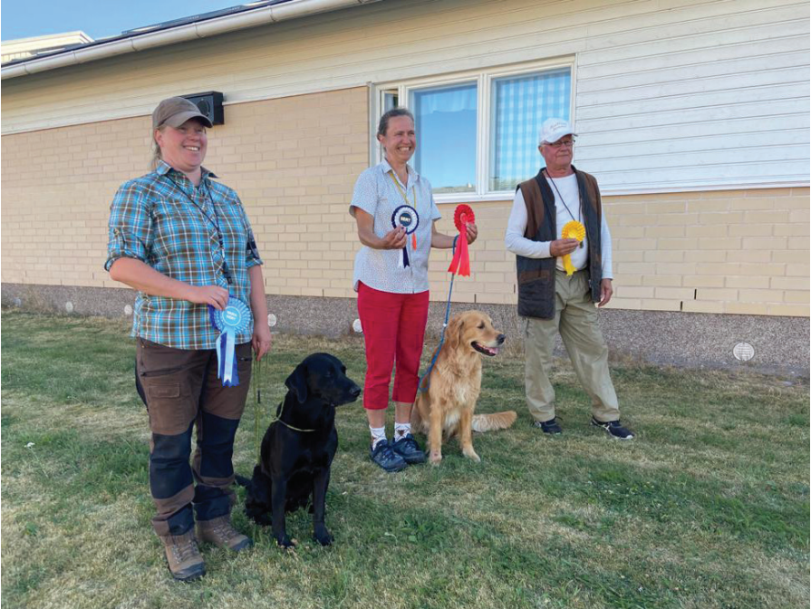
Kemiön WT-kokeen voittajaluokan kolmikko, kuva: Julia Gustafsson