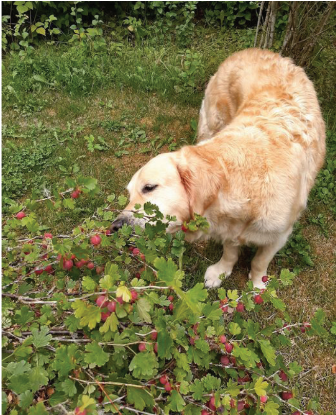
Manta nauttii karviaismarjoista