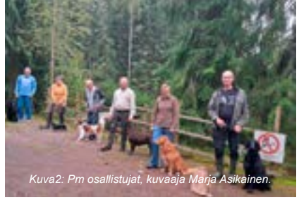
Kuva2: Pm osallistajat.