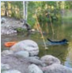
Kuva1: Koiran vie pelastustenkään veneeseen