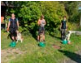
VOI-luokan palkit / TOKO-koe 080924