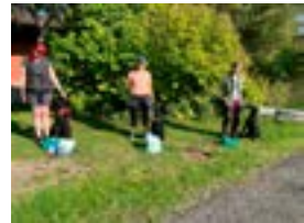
ALO-luokan palkit / TOKO-koe 080924