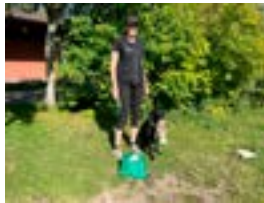
AVO-luokan palkit / TOKO-koe 080924