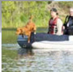
Kuva2: Koiran hyppää veneestä