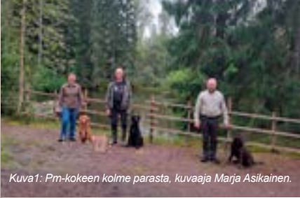
Kuva1: Pm-kokeen kolme parasta.