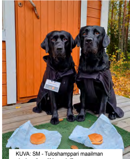
KUVA: SM - Tuloshamppari maailman pienimmän mökin portailla

Olin tavattoman tyytyväinen Onnin suoritukseen. Kyllä, siitähän huolimatta, että vain 100m ennen jäljen loppua Onni otti kaksi hukkaa ja 1-tulos putosi 3-tulokseen. Siitäkin huolimatta, että olimme SM-kokeissa ja jopa mahdollinen finaali paikka liukui sormien välistä hukkien myötä. Olin onnellinen, tyytyväinen ja niin ylpeä Onnin suorituksesta, sillä se oli jäljestänyt yli kilometrin matkan sille vieraassa ympäristössä, vieraissa tuoksuissa, pitkän matkustamisen jälkeen, merkannut kaikki makaukset, selvittänyt kaikki kulmat ja tehnyt hienoa työtä lähes kaadolle saakka. Onni oli selvittänyt tiensä SM-kokeisiin, joka jo se oli meille upea kokemus ja saavutus. Vieraalta tuoksuivat eläimet, meille hiukan epäedullinen tuulen suunta ja Onnin kiinnostus selvittää vieraan tuoksun lähde ei himmentänyt lainkaan sitä tunnetta, mikä minulla oli, kun Onni osoitti kaadon ja tehtävä oli suoritettu. Kehuin ja pussasin Onnia kaadolla, palkitsin sen maksalaatikolla kuten meillä tapana on ja kerroin sille kuinka hurjan taitava ja pätevä poika se onkaan! Onni kantoi ylpeänä sorkan kaadolta autolle saakka, ja lupasin Onnille, että tottakai käydään hakemassa netuloshampparit, jotka nekin meidän sopimukseen koirien kanssa kuuluu.