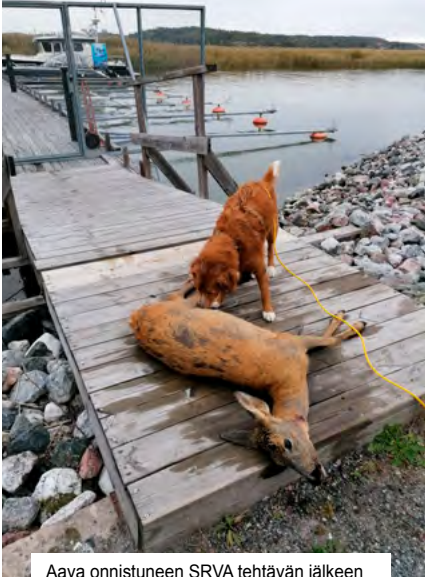
Aava onnistuneen SRVA tehtävän jälkeen

Pimeällä ei muuhun voikaan luottaa, kuin koiran aisteihin ja vain kävellä perässä. Onnistumisen tunne on mahtava, kun otsalampun valokeilaan osuu edessä kiiluvat eläimen silmät. Kokeissa olen monesti itsekseni harmitellut, että miksi