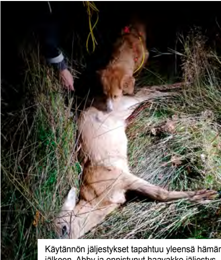
Käytännön jäljestykset tapahtuu yleensä hämärän jälkeen. Abby ja onnistunut haavakko jäljestys.

Olen jo kauan harrastanut Tollereitteni kanssa MEJÄ-kokeita (metsästyskoirien jäljestämiskoe). Vuonna 2006 osallistuin ensimmäiseen kokeeseeni silloisen oman kasvattini Tuikun, Waterfox Tic-Tac, kanssa. Kokeesta tuli heti avoimen luokan 1.-tuulos, joten MEJÄ:n koukkuun jäin ja sillä tiellä olen.